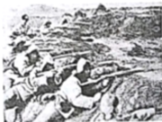
东北抗日队伍抗击日军