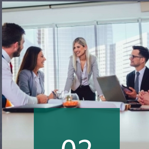
在职员工技能提升培训