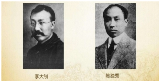
马列主义在中国传播