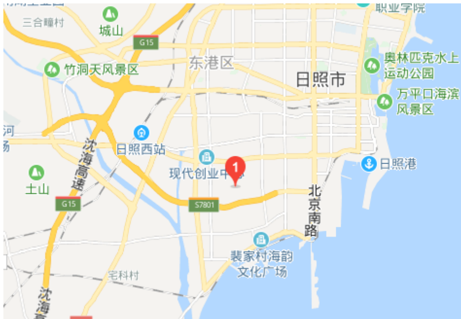
项目区域位置示意图