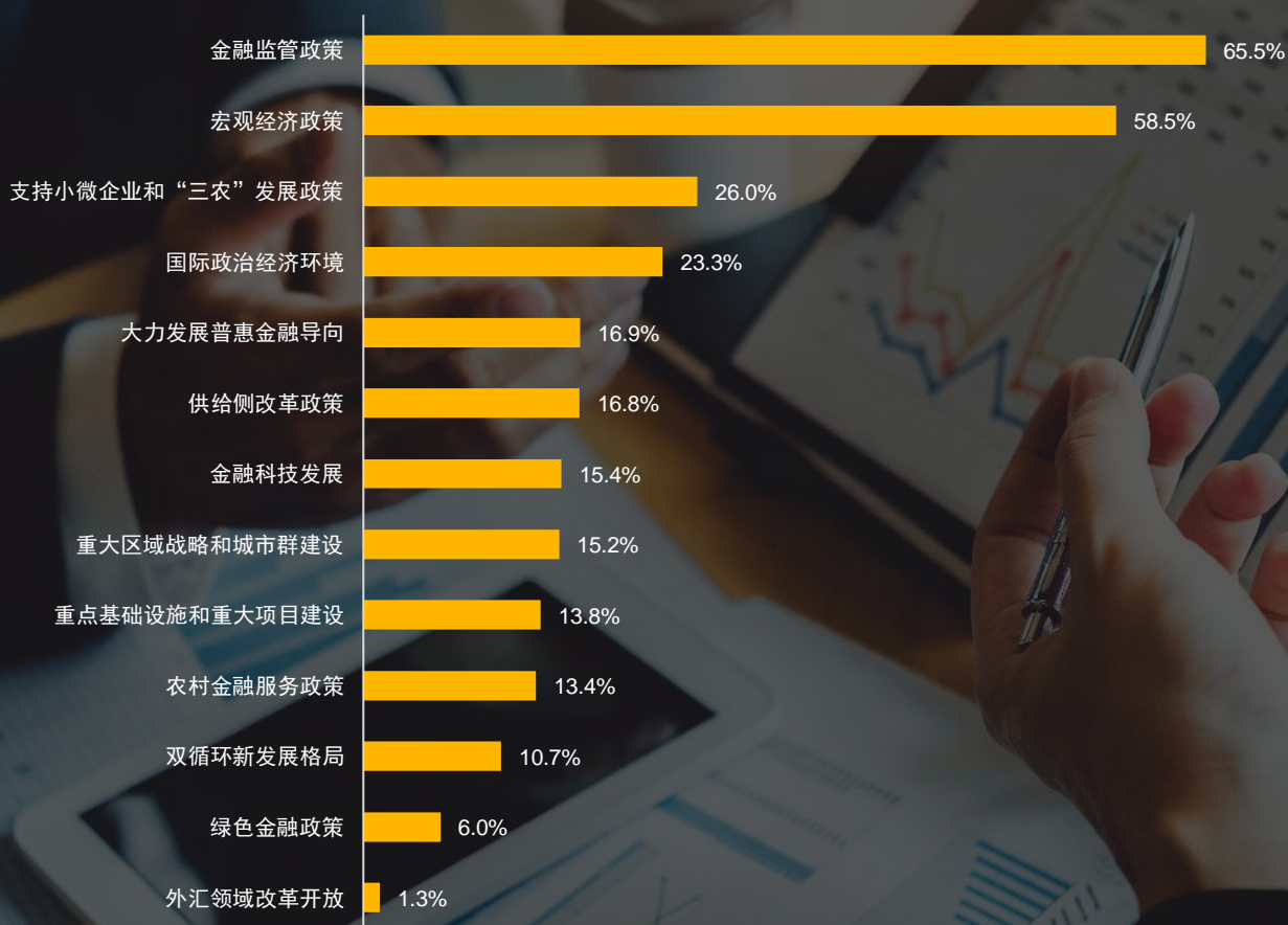
图2 银行家日常经营中最为关注的外部环境因素

从银行家日常经营中最为关注的外部环境因素来看，调查结果显示，金融监管政策（65.5%）和宏观经济政策（58.5%）继续保持前两位，且关注度明显高于其他因素。此外，“支持小微企业和‘三农’发展政策”（26.0%）、“国际政治经济环境”（23.3%）和“大力发展普惠金融导向”（16.9%）等因素也受到银行家的广泛关注（图2）。