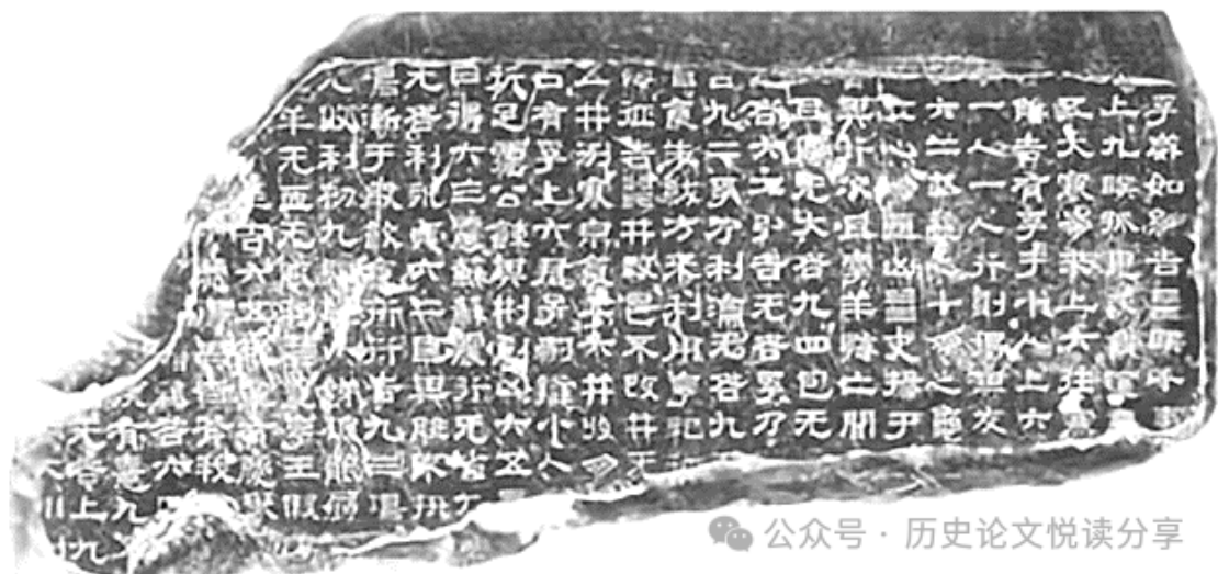
公众号·历史论文悦读分享