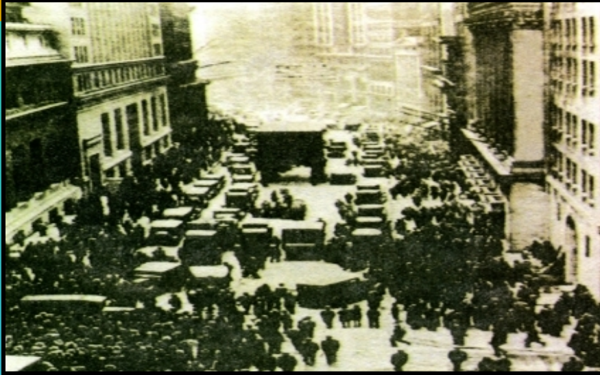
图一 黑色星期四的华尔街