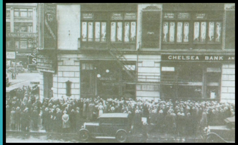
图二 1930年美国银行前的挤兑人群