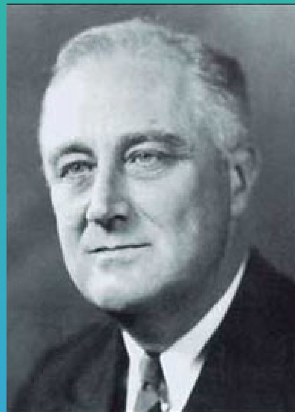
罗斯福首次就职演说 (1933年3月4日) (节录)

我们的国家过去经得起考验，今后还会经得起考验，复兴起来，繁荣下去。因此，首先，允许我申明我的坚定信念：我们唯一值得恐惧的就是恐惧本身——会使我们由后退转而前进所需的努力陷于瘫痪的那种无名的、没有道理的、毫无根据的害怕。在我们国家生活中每一个黑暗的时刻，直言不讳，坚强有力的领导都曾经得到人民的谅解和支持，从而保证了胜利。我坚信，在当前的危机时期，你们也会再一次对领导表示支持。