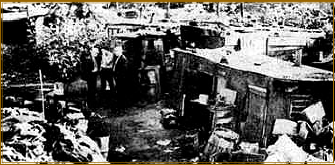
失业者搭建的简陋棚屋（1931年）

“梅隆拉起警笛，胡佛敲起钟，华尔街发出信号，美国朝地狱里冲。”——美国民谣 （注：安德鲁·梅隆是美国20年代三任总统的财政部长）