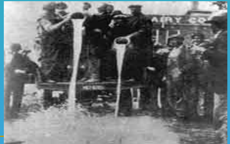
图四 农场主销毁“过剩”牛奶