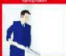
⑥ 对准火源根部，进行灭火 Aim at fire's root to put out fire