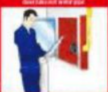
④ 另一头盖上消防水枪 Get both ends onto the water gun