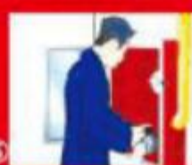
⑤ 另外一人打开消防栓上的水阀开关 If another person is operating the hydrant, then, fight the fire first