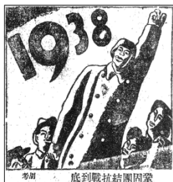
图 1：巩固团结抗战到底 刊于 1938 年 1 月

材料三 《新华日报》是在抗战时期创办的机关大报，报中刊发了大量抗战宣传版画，以下为其中的一部分：