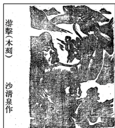
图 2：游击 刊于 1938 年 5 月