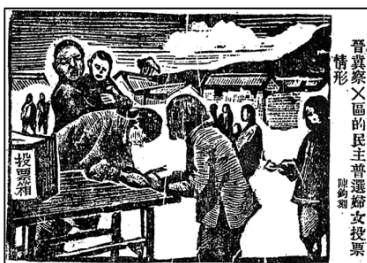
图 3：边区政府民主普选妇女投票情形 刊于 1940 年 2 月

(1) 材料一能否为材料二的观点提供佐证？请说明理由。（要求：引用材料一的信息进行具体的分析说明。）