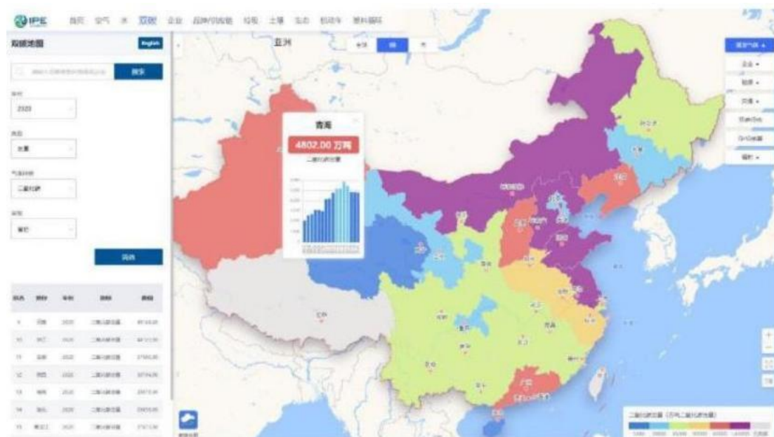
图1蔚蓝双碳地图

碳排放核算范围： 本报告碳排放核算范围为各省份主要化石能源燃烧活动（煤炭、油品和天然气等）的直接碳排放量以及电力调入的间接碳排放量。各省碳排放量和双碳指数结果可通过蔚蓝地图网站查询双碳地图获取（见图1）。