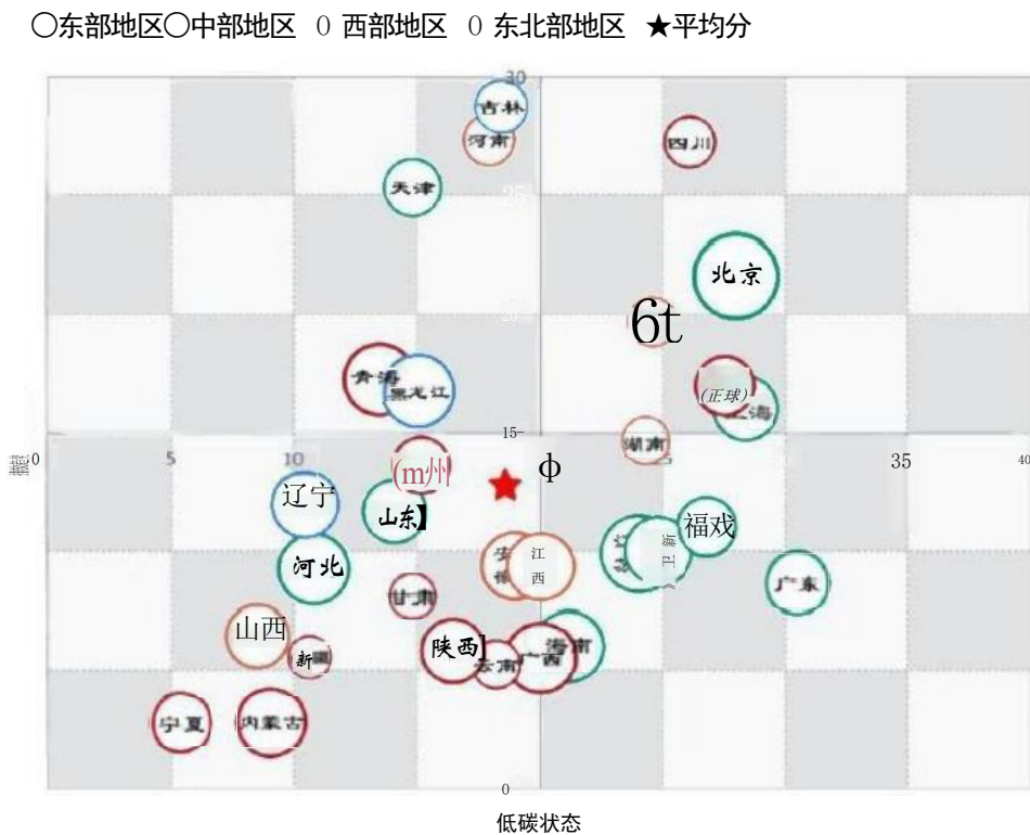
图4省级双碳指数评价“全国一盘棋”示意图

注：象限图分别以一级指标“低碳状态”和“减排趋势”的评分为坐标轴，以“气候雄心”的评分为气泡的大小进行呈现。