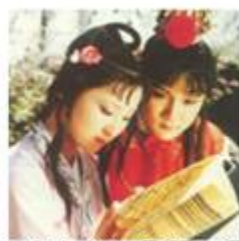
① 《青春之歌》剧照 ② 《红灯记》剧照 ③ 《芙蓉镇》剧照 ④ 《红楼梦》剧照。