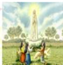
图一 图二 图三。

(1) 以上三幅圣母像中那幅作品可能是文艺复兴时期的？说明你的判断理由？(2 分)