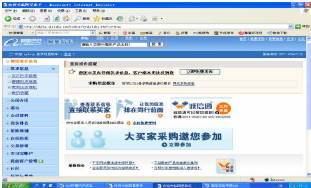
图 2.2.1 登录“我的阿里助手”