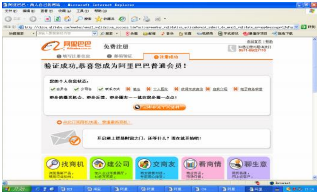
图 2.1.5 注册成功窗口

5. 单击“点此确认”字样的超级链接后，系统会返回显示注册成功窗口，注册账号也就被激活。如图 2.1.5 所示：