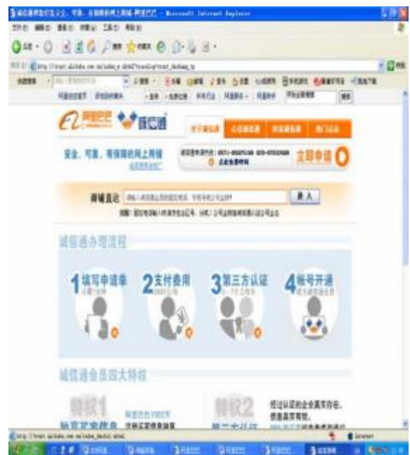
图 2.1.7 (b) 诚信通主页

8. 在图 2.1.7 的诚信通主页上，有“关于诚信通”、“众说诚信通”、“申请诚信通”、“热门活动”四个主要模块。单击“申请诚信通”按钮，就可以进入申请界面，如图 2.1.8 所示：