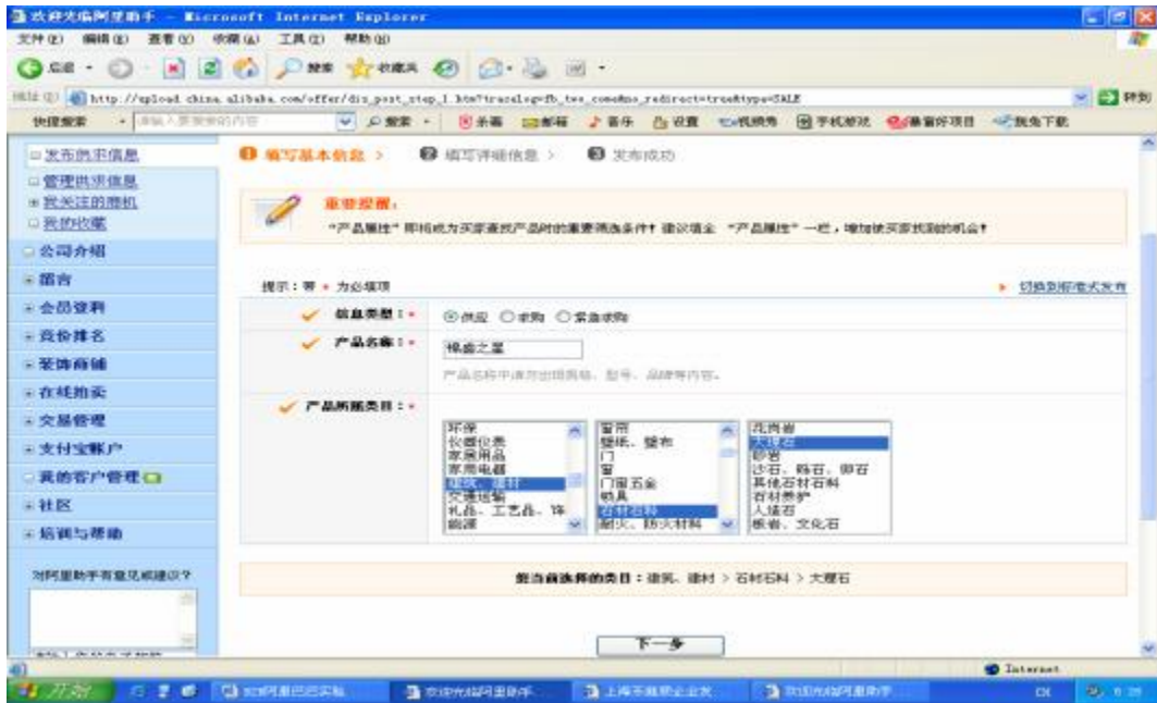
图 2.2.4 发布产品信息

6. 单击“下一步”按钮，系统提示继续填写详细信息，包括信息标题、产品属性、详细说明、上传图片、信息有效期、交易条件、联系方式的确认与修改。普通会员只能上传一张图片。最后单击“一切完成，我要发布！”按钮就完成卖家的产品信息发布。如图 2.2.5 所示：