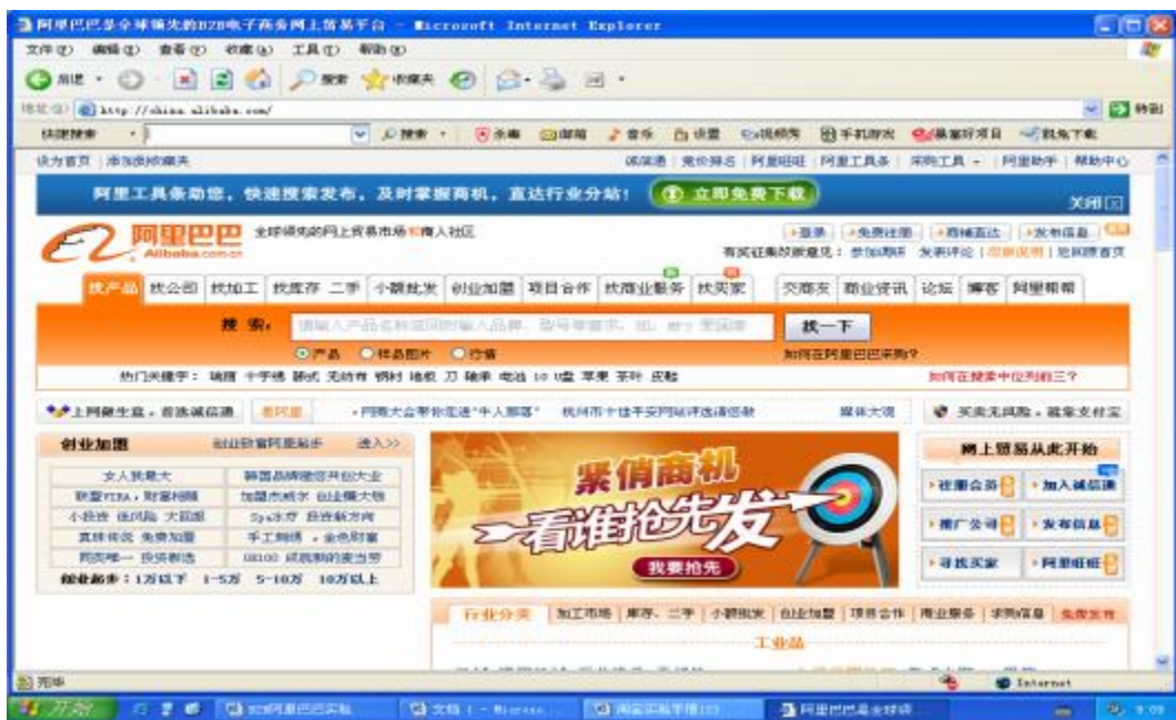
图 2.1.1 阿里巴巴中国网站主页