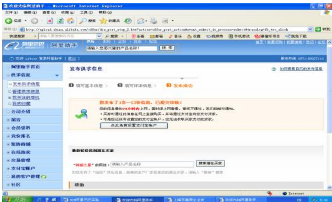
图 2.2.5 产品信息发布成功

6. 单击“下一步”按钮，系统提示继续填写详细信息，包括信息标题、产品属性、详细说明、上传图片、信息有效期、交易条件、联系方式的确认与修改。普通会员只能上传一张图片。最后单击“一切完成，我要发布！”按钮就完成卖家的产品信息发布。如图 2.2.5 所示：