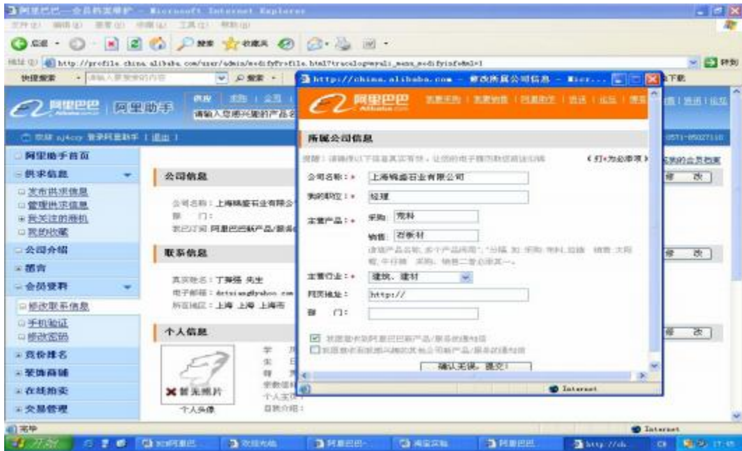
图 2.2.2 修改公司信息