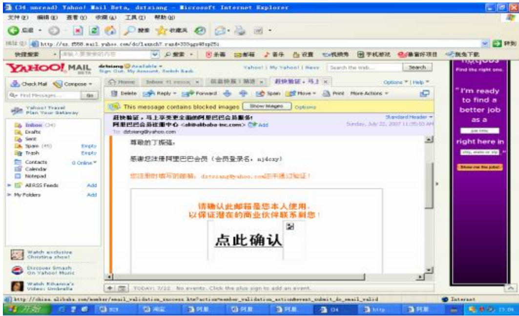
图 2.1.4 邮箱的确认

5. 单击“点此确认”字样的超级链接后，系统会返回显示注册成功窗口，注册账号也就被激活。如图 2.1.5 所示：