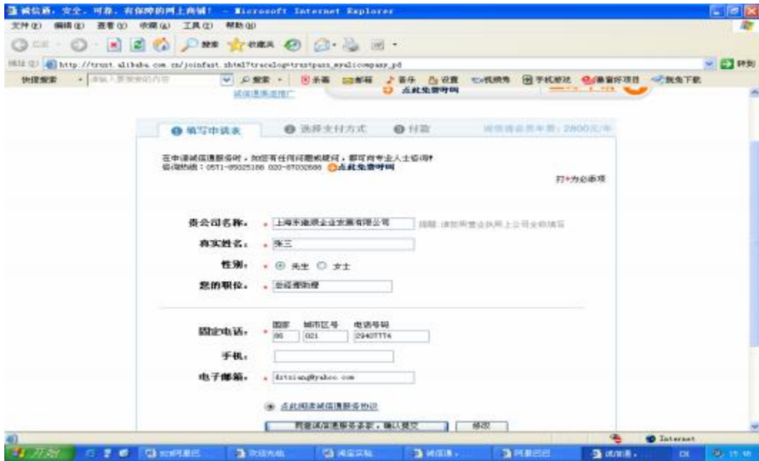
图 2.1.8 申请诚信通会员

9. 网上申请需要将公司名、申请人姓名、性别、职位、各种通信方式等资料提交给阿里巴巴公司。当相关信息填写完毕后，单击“同意诚信通服务条款，确认提交”按钮，系统显示提交成功信息。