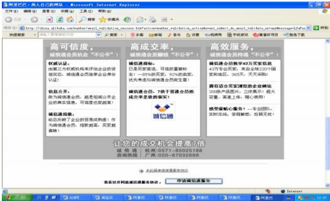
图 2.1.6 申请诚信通服务窗口

7. 单击“申请诚信通服务”按钮，或者登录阿里巴巴网站，单击导航条上标有握手图片的“诚信通”按钮，进入诚信通主页。如图 2.1.7 (a) - (b) 所示：