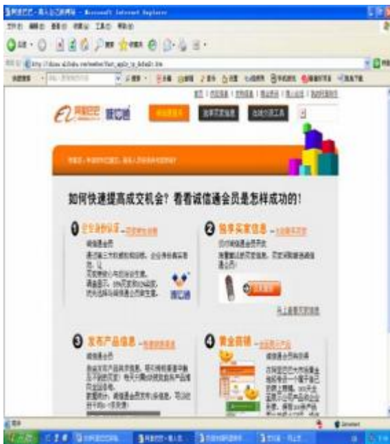
图 2.1.7 (a) 单击“申请诚信通服务”后出现的窗口

7. 单击“申请诚信通服务”按钮，或者登录阿里巴巴网站，单击导航条上标有握手图片的“诚信通”按钮，进入诚信通主页。如图 2.1.7 (a) - (b) 所示：