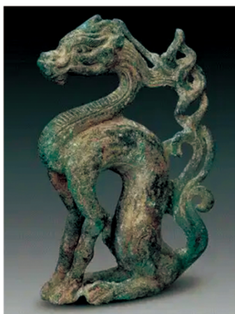
金中都铜坐龙（首都博物馆）