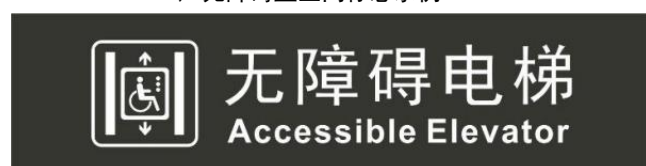
图 10 无障碍设施标志示例

6.1.11 母婴室设施标志应设置在母婴室专用设施的上方或附近位置。见图 11。