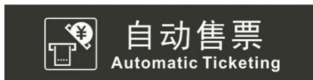
图 6 自动售票标志示例

6.1.5 自动售票标志应提供自动售票机的位置，见图 6，可设置在自动售票机上方或附近。