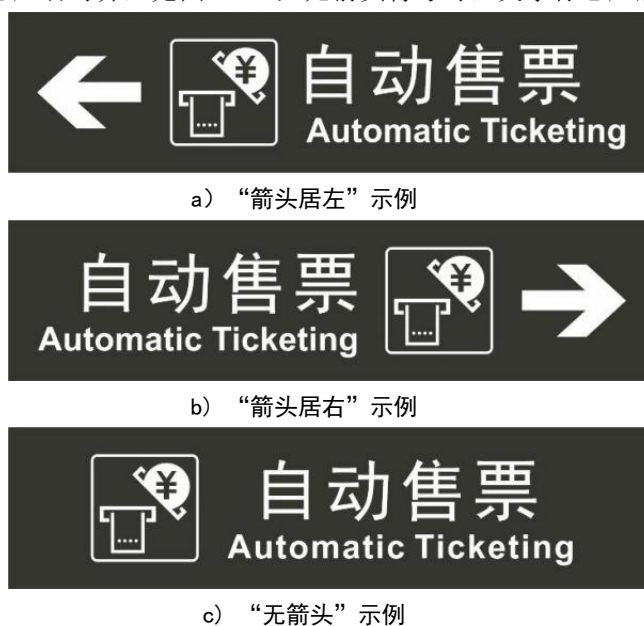
图 1 导向标志版面中英文对齐方式设计示例

Arial。文字标志与箭头符号组合时，箭头符号在标志左侧时，文字标志应左对齐，见图 1a)；箭头符号在标志右侧时，文字标志应右对齐，见图 1b)；无箭头符号时，文字标志应居中对齐，见图 1c)。