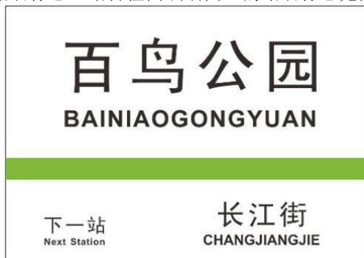
图 5 站台柱面或墙面上的站名标志示例

6.1.5 自动售票标志应提供自动售票机的位置，见图 6，可设置在自动售票机上方或附近。