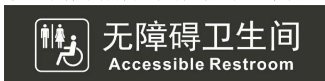
a) 无障碍卫生间标志示例

6.1.10 无障碍设施标志应设置在无障碍专用设施的上方或附近位置。见图 10。