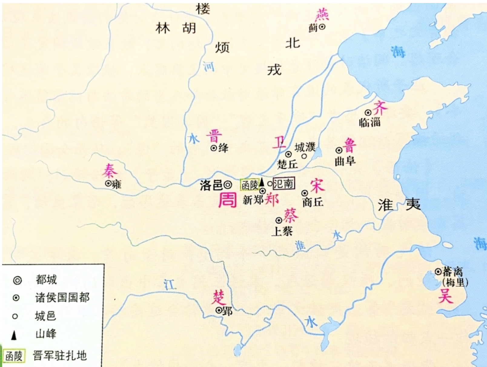
春秋列国形势简图