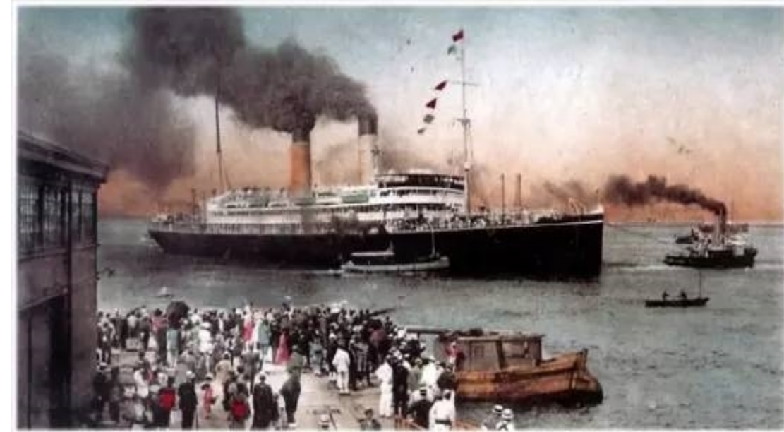
黑船事件：1853年，美国佩里派舰队入侵日本