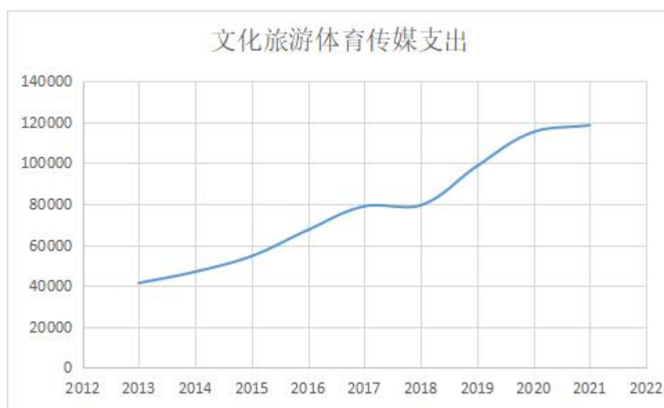
图 3.2 南昌市一般公共预算支出

经由对南昌市国民经济和社会发展统计公报还有南昌统计年鉴进行查阅后了解到，南昌市文化产业具体划分如下板块，首先是新闻和出版业，接着是广播和电影电视，还有就是文化艺术业以及影视录音制作业。