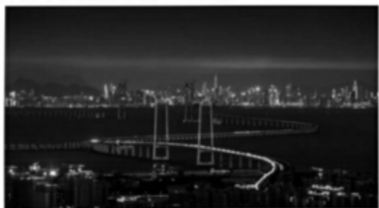
夜色中的深中通道

(6)小光和小明一起参观了深中通道，拍摄了一组照片，小明模仿小光的文句，在照片背后表达了赞美之情。