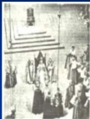
①斯图亚特王朝复辟