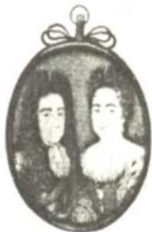
③英国女王玛丽和国王威廉