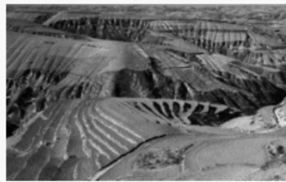
第 1、2 题图

下图为黄土高原局部景观图,该区域内植被多呈斑块状、有序地重复出现。完成 1、2 题。