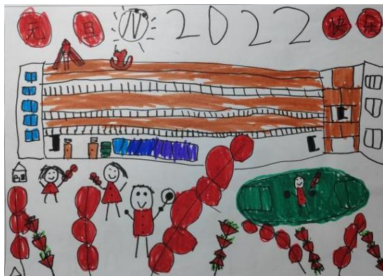
图 2-19 操场上开派对 (Z-D3-HXY-H)