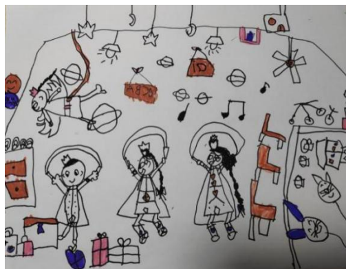
图 2-20 灯光球场 (X-D4-XXH-H)