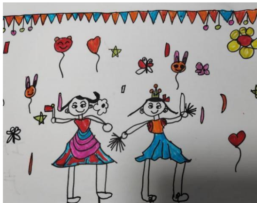
图 2-13 和我的好朋友跳舞 (X-D4-LZY-H)

一步询问“为什么希望和自己的好朋友一起参与节庆活动？”时，幼儿表示朋友可以为他们带来积极的情绪体验，此回答在绘画中也得到了印证，幼儿绘画作品中人物脸上都露出了欢乐的笑容。值得注意的是，大部分幼儿所提到的朋友皆是所在班级中的朋友，只有个别幼儿谈到了其他班的或者生活中认识的朋友，这说明了班级是幼儿进行交往活动的主要场所，空间距离越近幼儿与同伴越容易产生亲密的关系。