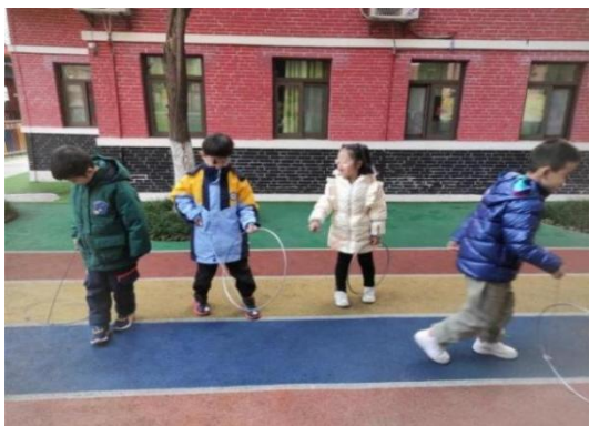
图 2-3 民间游戏滚铁环 (X-D1-WHX-S)