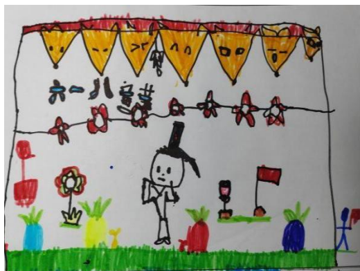
图 2-21 有花、有草的地方 (S-D2-LDF-H)

“想在草地上，宽阔一点的地方。”(S-D2-YJL-F) “想把那些植被弄成很多形状，就像公园那样。”(X-D4-HYX-F) “希望有太阳、小鸟，有蝴蝶飞来飞去，还有彩带。”(X-D4-LZY-H，见图 2-22) 说明幼儿希望在自然的场景中进行节庆活动，温暖的太阳、绿色的植被、鲜艳的花朵等生机勃勃的自然能给他们带来美好的视觉享受，使他们的身心感到放松和愉悦。