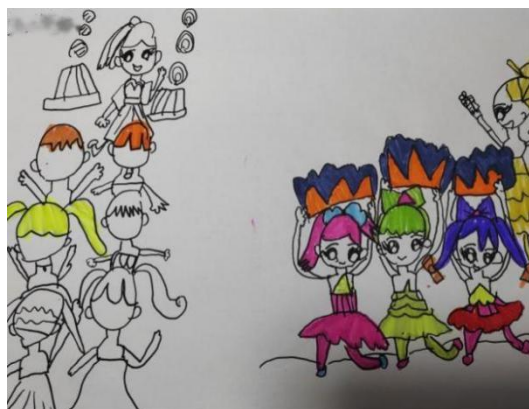
图 2-17 老师带我们跳操 (X-D4-YME-H) 图 2-18 老师排练舞蹈 (X-D4-KSL-H)