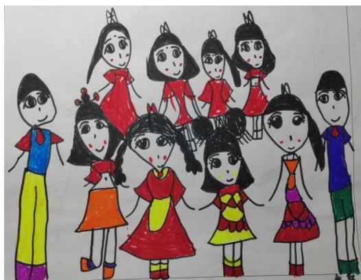
图 2-11 集体表演 (Z-D3-XZH-H)

“我希望和幼儿园中的每一位小朋友一起过。”(Z-D3-DYX-F)由此可见，在幼儿眼中他们不是一个孤立的个体，他们在主动与他者建立起人际交往圈。他们希望有集体的陪伴，这源于当幼儿踏进幼儿园时，幼儿就已生活在一个集体环境之中，他们从单一的家庭环境走向具有社会模式的幼儿园，其活动范围不断扩大，社会关系变得更加多样、复杂，因此幼儿的集体感也在逐渐增强。