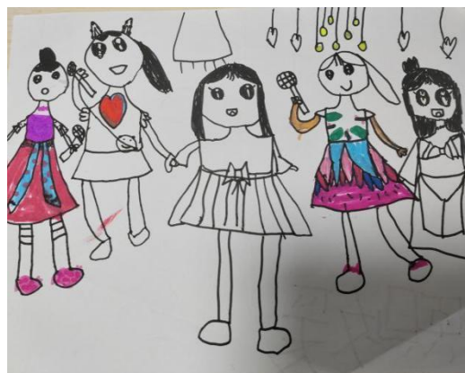
图 2-10 唱歌表演(X-D4-ZXY-H)

综上所述，可以用“生活”“游戏”“表演”来概括幼儿理想的幼儿园节庆活动内容。多样化的游戏体现出节庆活动的娱乐性，节庆中的生活习俗体现出活动的生活性，节庆中的舞台表演体现活动的仪式性。游戏是幼儿的天性，它具有调节心身的功能，可以让幼儿消除疲惫，心身感到愉悦，因此游戏是幼儿理想的节庆活动的重要内容。在生活体验方面，大班幼儿在认知能力已有显著提升，对节庆中的基本习俗和仪式已有潜在了解，这说明幼儿已具备一定的节庆文化经验。除此之外，幼儿在日常生活中的生活娱乐也成为幼儿期待的节日活动内容。最后，舞台表演其有独特的娱乐性、观赏性、仪式性，幼儿在舞台表演展示自我，有助于满足自我表现的欲望需求，但因受到儿童兴趣、爱好以及已有经验的影响，幼儿对舞台的表演期待更多倾向于他们已经参与或即将要参与的活动。