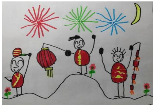
图 2-5 挂灯笼、放鞭炮 (Z-D3-YMT-H)