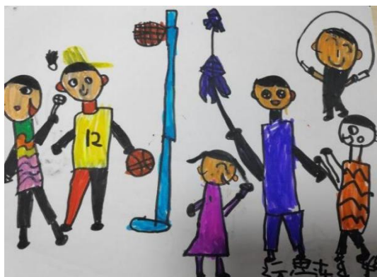
图 2-1 打篮球、放风筝(X-D4-CSY-H)

很显然,幼儿喜欢的节庆游戏非常广泛,不管是传统还是创新的游戏,抑或是与节庆活动本身不相关的游戏,但这些对幼儿来说都具有很强的吸引力。幼儿在游戏中宣泄、释放自己的情绪情感,也可以获得满足感和幸福感。