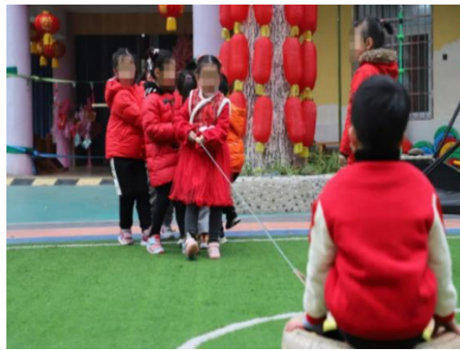
图 2-4 “你坐我拉”游戏 (Z-D3-FHY-S)