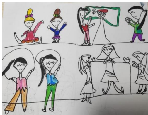
图 2-2 有各种各样的游戏(X-D4-ZRE-H)