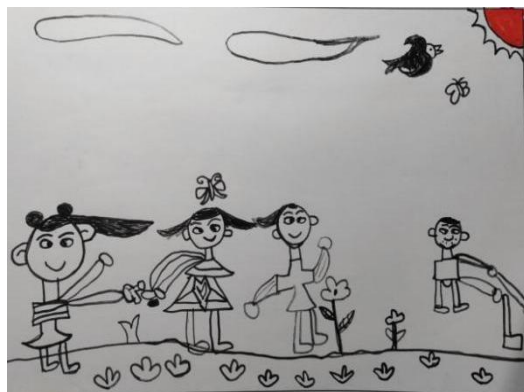
图 2-22 有花、蝴蝶和小鸟 (X-D4-LZY-H)