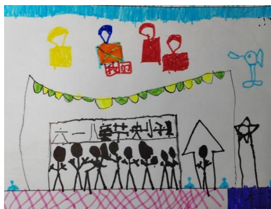
图 2-12 大二班所有人一起 (S-D2-DH-H)