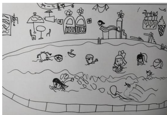
图 2-7 水上乐园 (S-D2-ZZR-H)