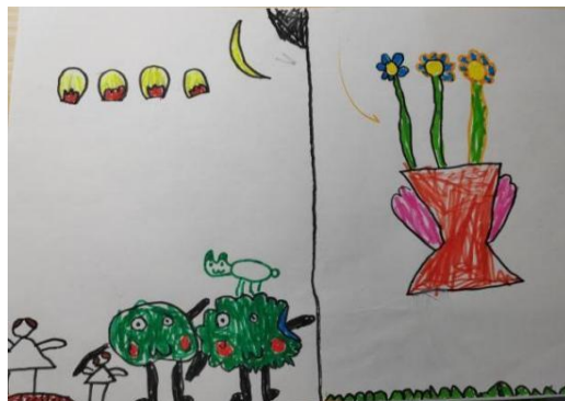
图 2-6 赏月 (E-D2-WQN-H)