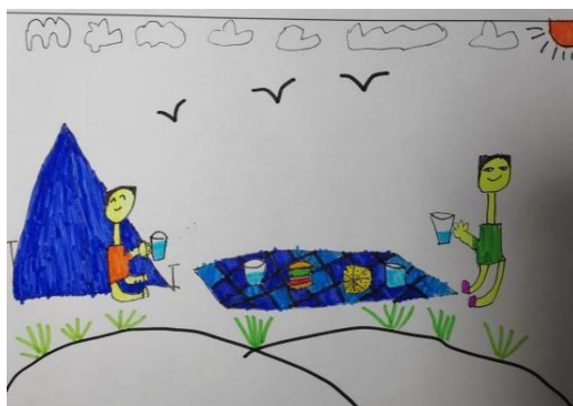
图 2-8 野餐 (S-D2-HMC-H)