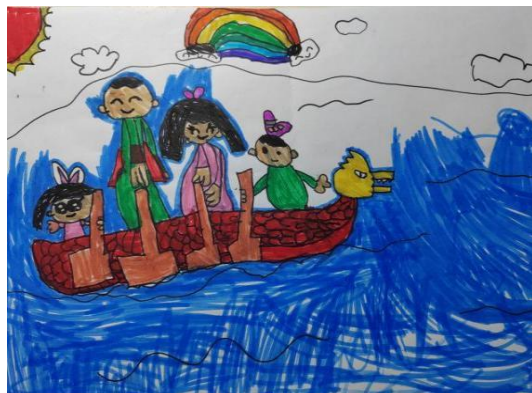
图 2-15 团团圆圆过元旦 (Z-D3-HXY-H) 图 2-16 全家人一起划龙舟 (X-D4-LZA-H)