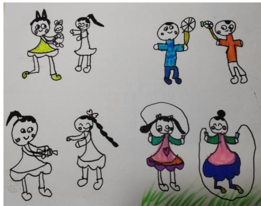
图 2-14 他们都是我的朋友 (X-D4-JXT-H)