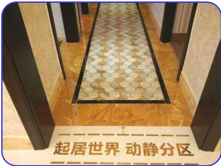
地砖铺贴排版合理美观 河南新乡凤凰湾