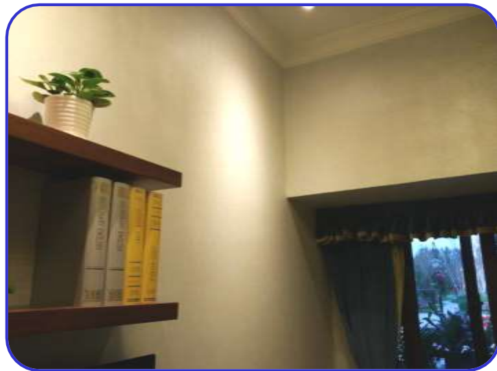
阴阳角方正、顺直 河南新乡凤凰湾