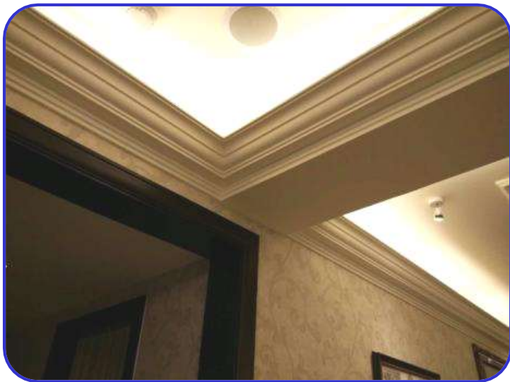
石膏线拼接顺直，层级分明 河南新乡凤凰湾