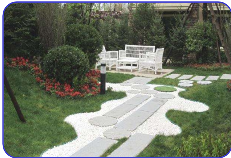
园林汀步造型优美 河南新乡凤凰湾