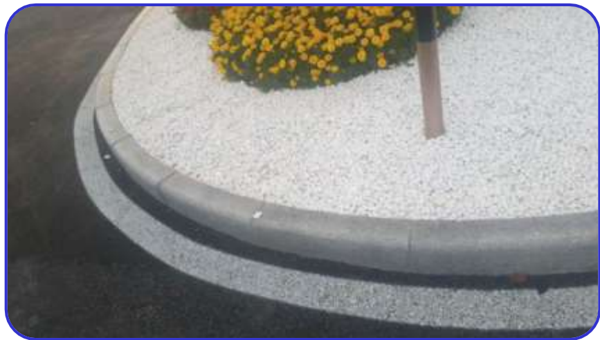
弧形路沿石拼接圆顺，縫隙大小一致 河南新乡凤凰湾