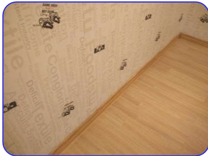
木地板踢脚线拼接顺直，严密 河南新乡凤凰湾