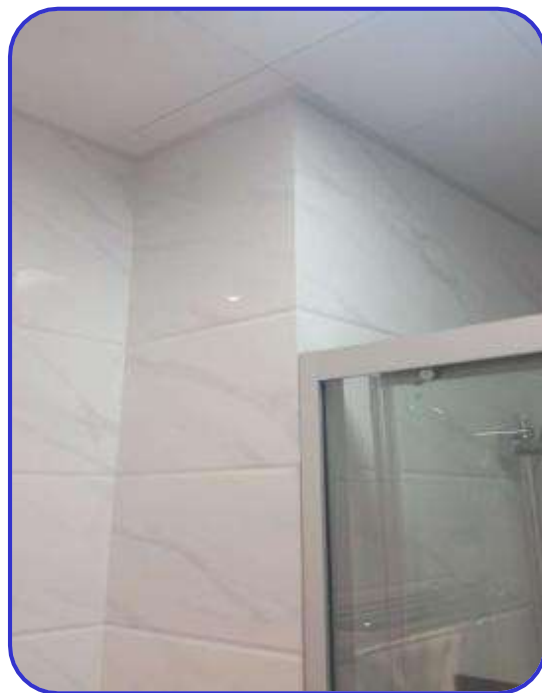
墙砖缝隙大小一致，海棠角拼接美观 河南新乡凤凰湾