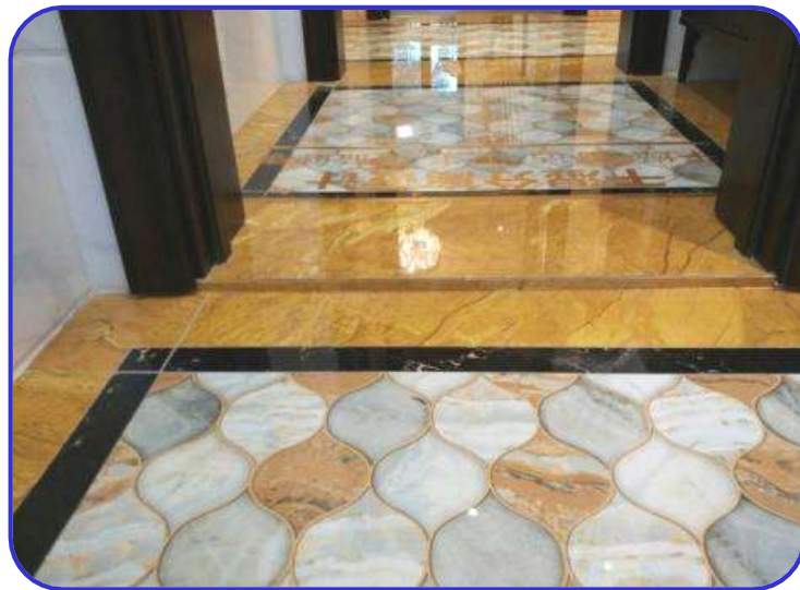
门槛侧面收口美观 河南新乡凤凰湾