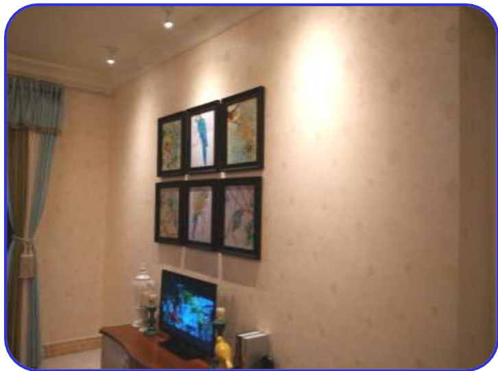
墙纸铺贴平整，纹理拼接吻合 河南新乡凤凰湾