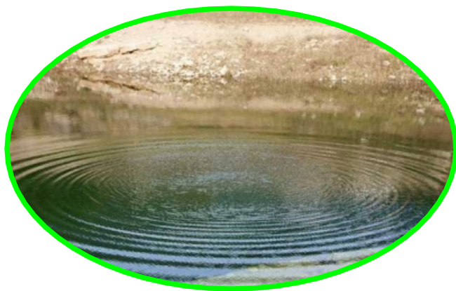
石子投入水中在 水面激起水波