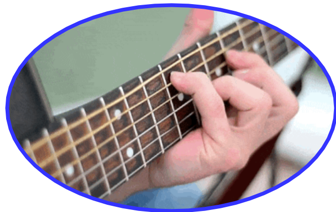
琴弦振动在空气 中激起声波