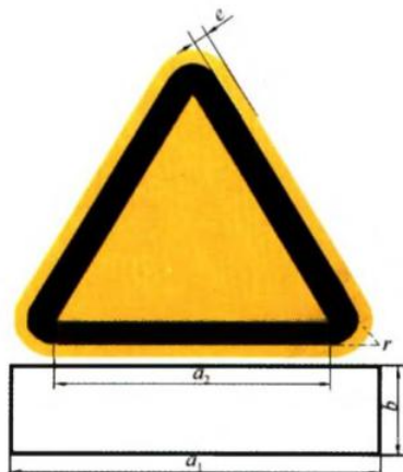
图 4.2.1 警告标志的基本形状

4.2.1 警告标志的基本形状应为顶角朝上的等边三角形，文字辅助标志应在其正下方（图 4.2.1）。