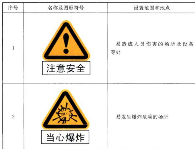
表 4.2.4 警告标志