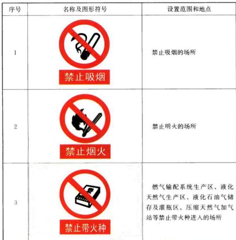
表 4.1.4 禁止标志