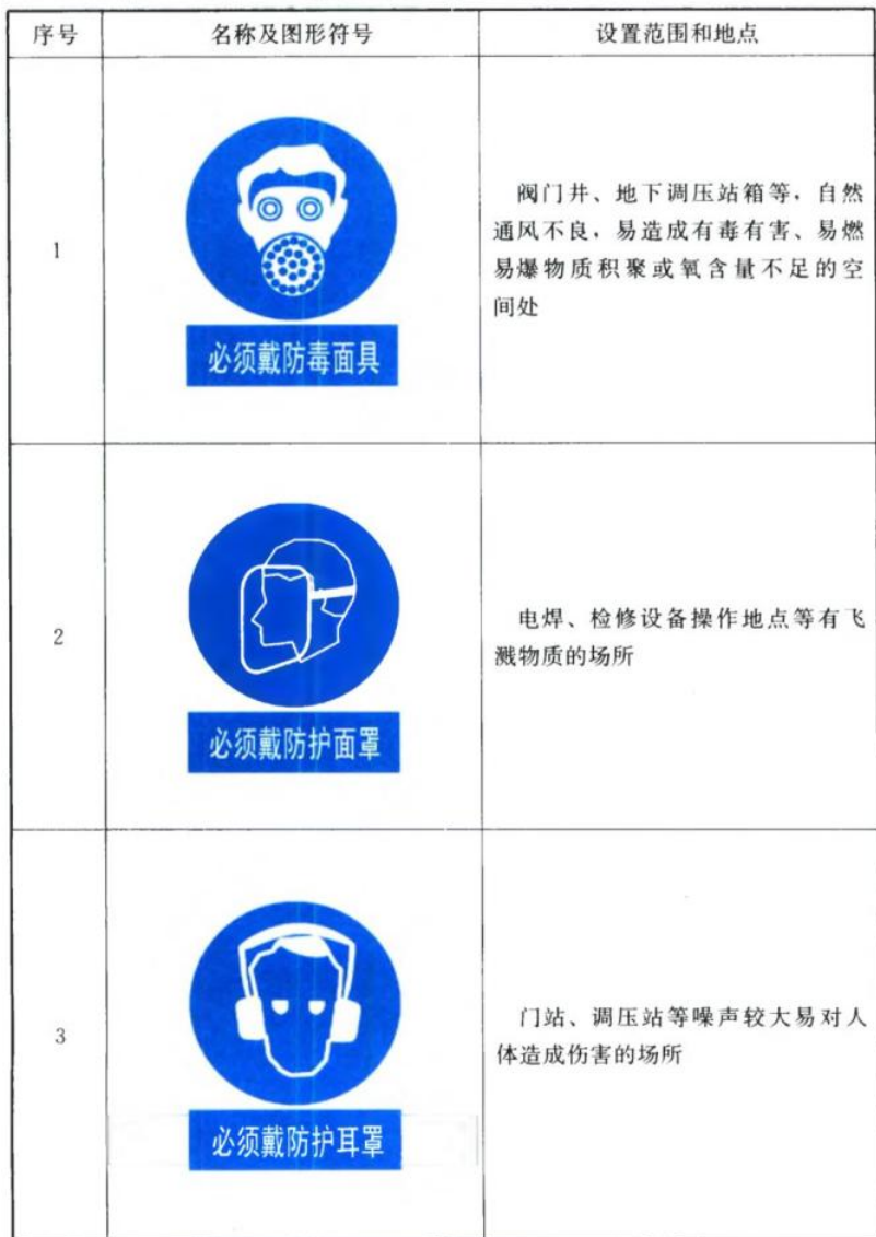
表 4.3.4 指令标志