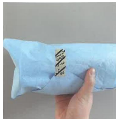
③检查外包装情况、有效日期