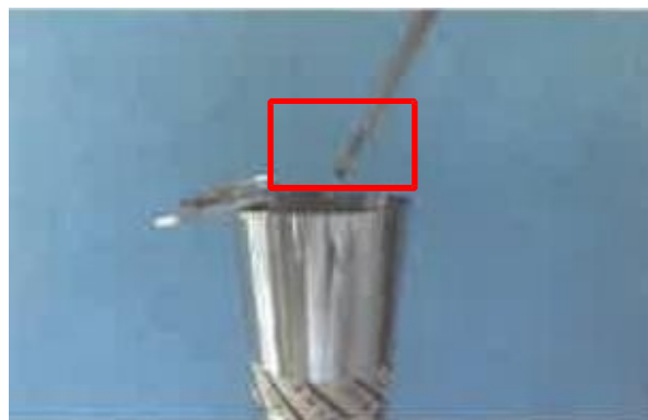
⑥钳端闭合，取出持物钳