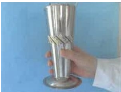
⑦远处取物，应整体移动钳罐