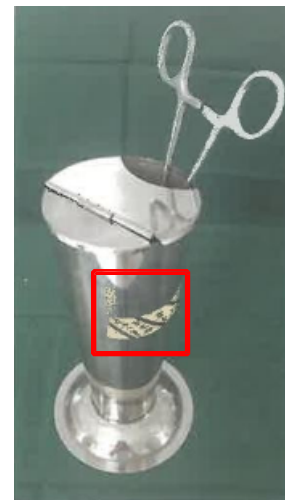
④打开钳包，取出钳罐；注明开启时间