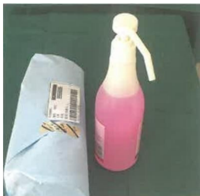
①评估操作环境、物品准备