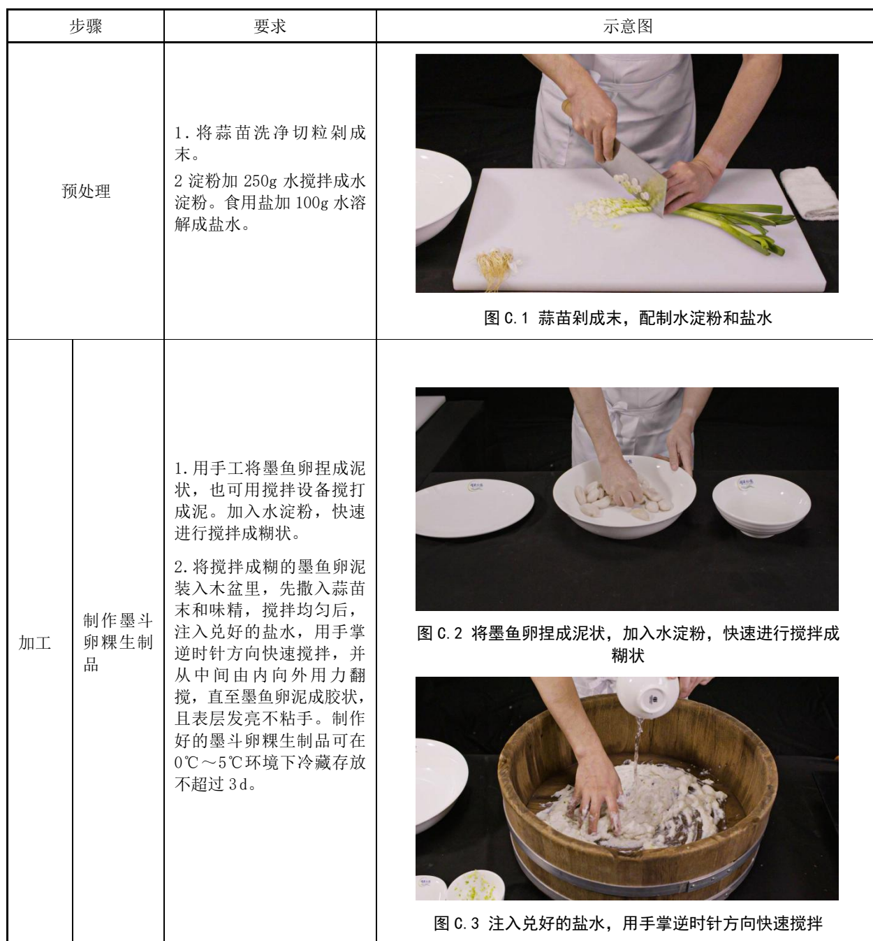
表 C.1 墨斗卵粿烹制操作步骤图