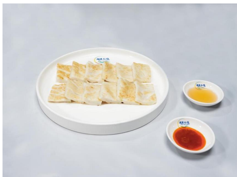
图A.2 墨斗卵粿成品图