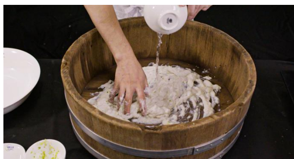
图 C.3 注入兑好的盐水，用手掌逆时针方向快速搅拌