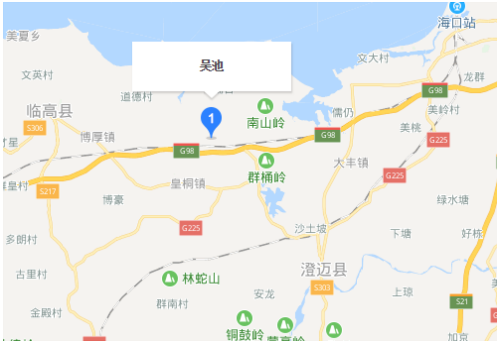
项目区域位置示意图