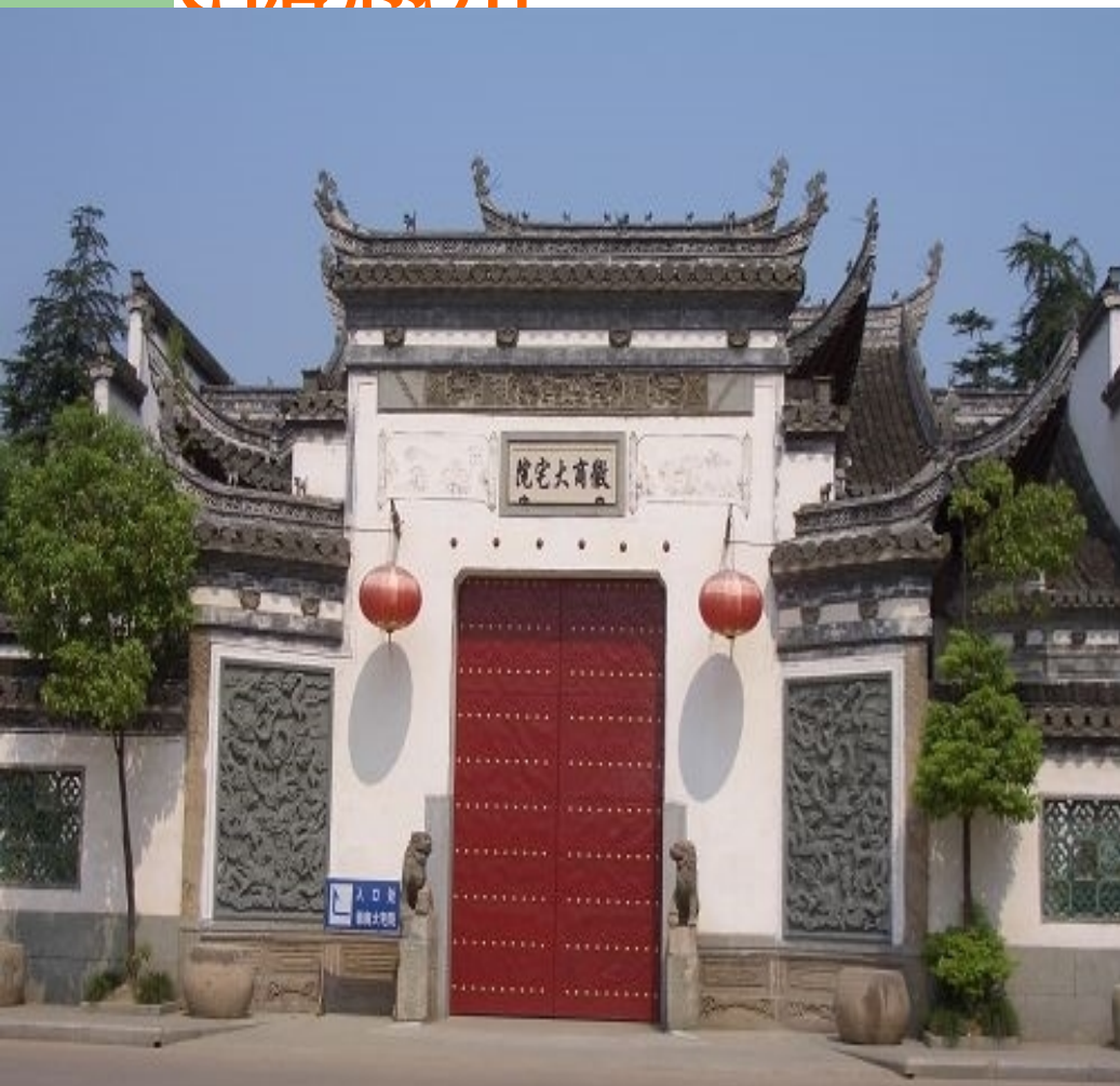
歙县26栋古建筑异地 搬迁后组建成徽商大宅