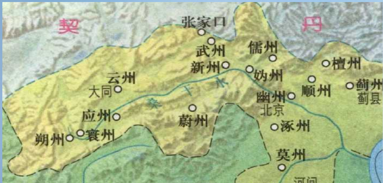
幽云十六洲示意图