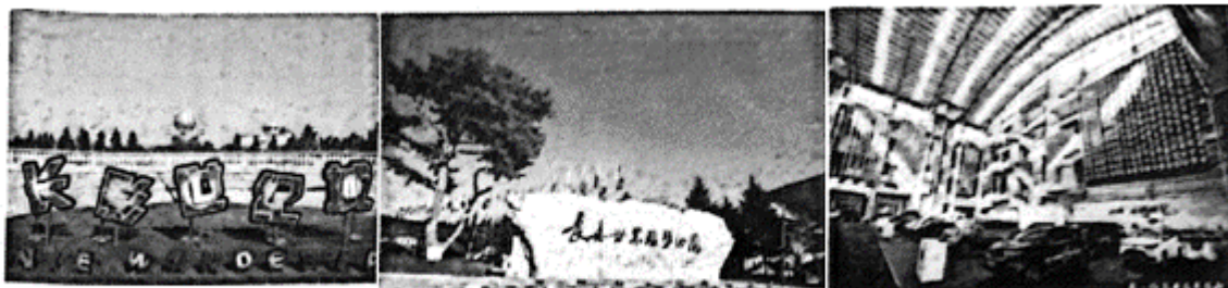
①长影世纪城 ..... ②长春世界雕塑园 ..... ③一汽红旗文化展馆

24. 【探家乡】为了推介长春市旅游资源，请你将下面景点恰当推荐语序号填写在横线上。