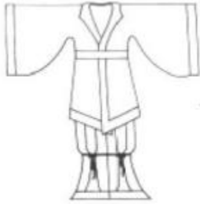
左：穿裤褶、缚裤的男子（北朝陶俑） 右：裤褶、缚裤示意图