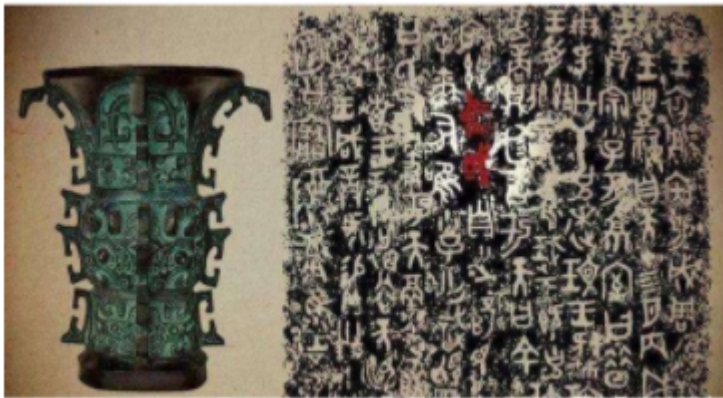
何尊及“铭文”中的中国

1. 1963 年，陕西省宝鸡市出土了西周早期周成王时的青铜器“何尊”，内底铸铭文 12 行 122 字，提到周武王灭商后决定建都于天下的中心，文中“宅兹中国”(下图)，与《尚书》等文献记载可互证。此铭文是（ ）