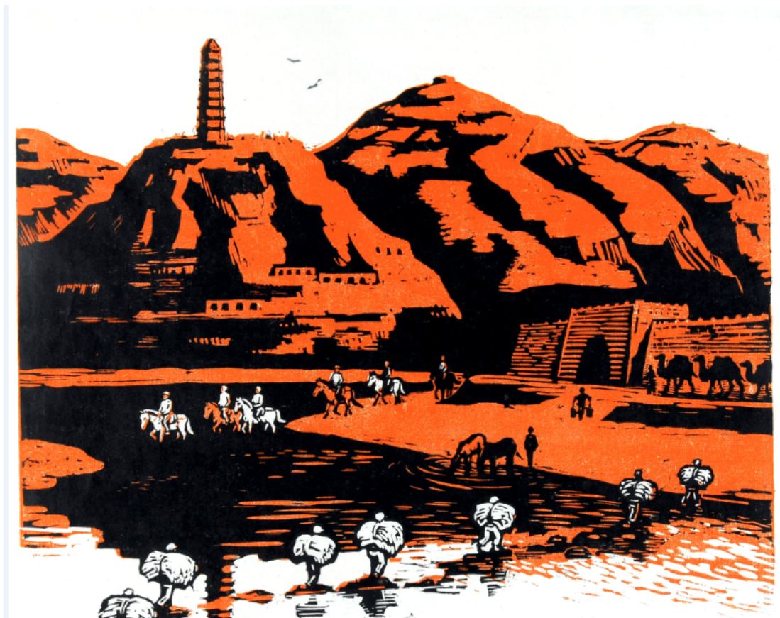
古元版画《回忆延安》

《回忆延安》是古元（1919—1996）同志在 20 世纪 70 年代创作的原拓木刻套色纸本版画，长方形，宽 60 厘米，长 80 厘米，画面主题色调为黄色、蓝色和绿色，生动精细地展现了延安时期中国共产党人在宝塔山下、延河之滨为民族独立和人民解放而自力更生、艰苦奋斗的史诗般画卷。