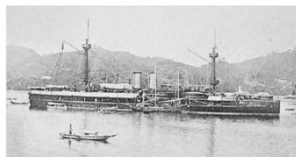
北洋舰队“定远号”铁甲舰