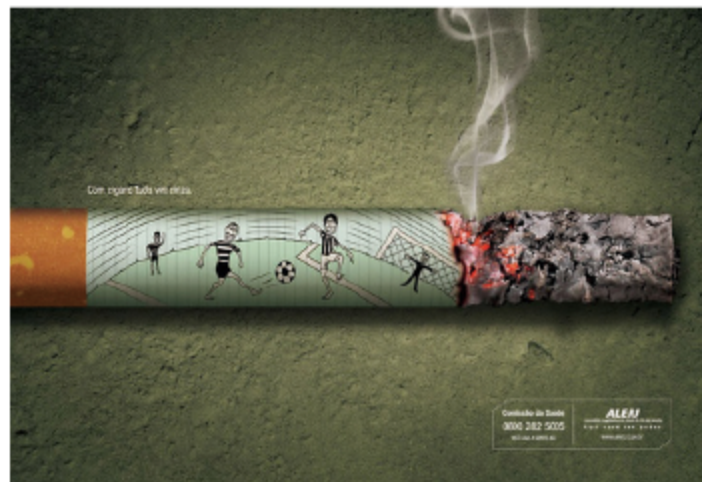
图4-9 伴随着香烟，你的生活化为灰烬/巴西Staff

有些事物在外形上或内容上正好相反，人们看到这一事物就会联想起与之相反的事物，称为对比联想。例如：白天与黑夜；大与小；战争与和平等。（图4-9）