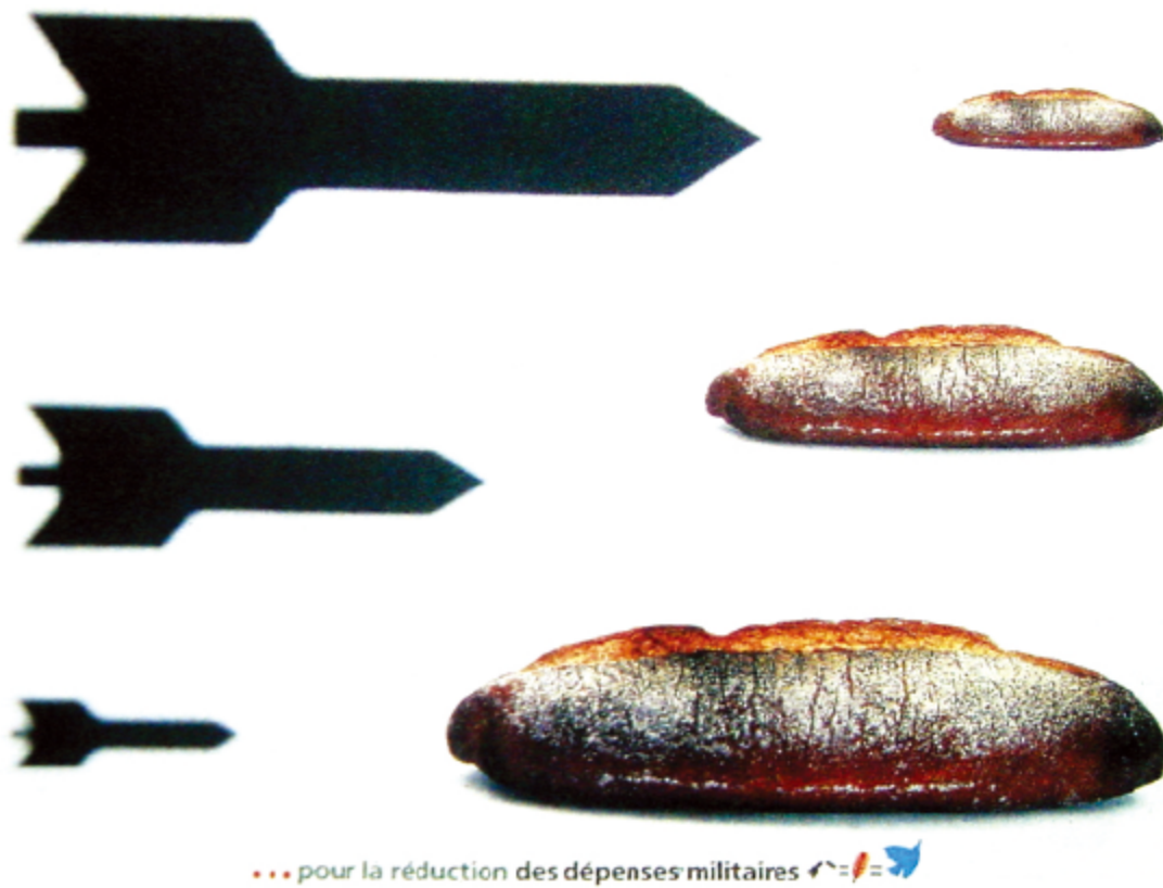
图4-10 减少军费/第埃尔·萨菲斯