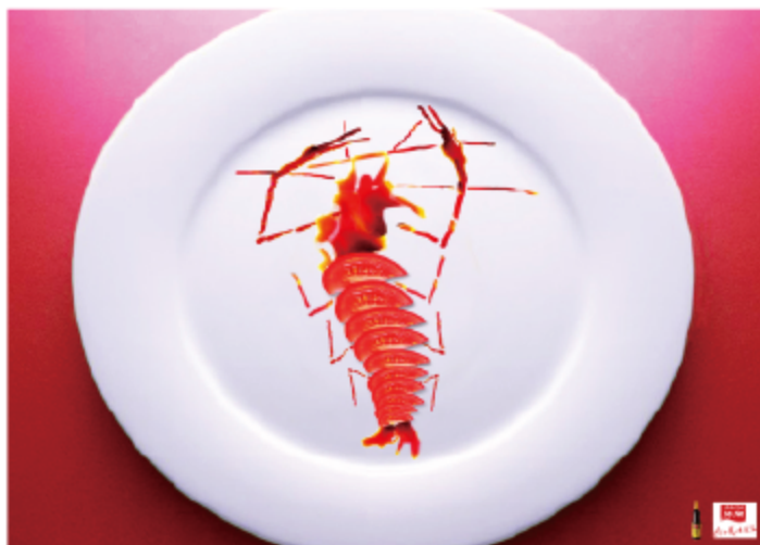
图4-6 加加酱油一虾篇/植文源/指导：王汀

构成主题思想的许多概念常常是虚的，看不见的，但它却与看得见的形体相关联而构成虚实联想。（图4-6）