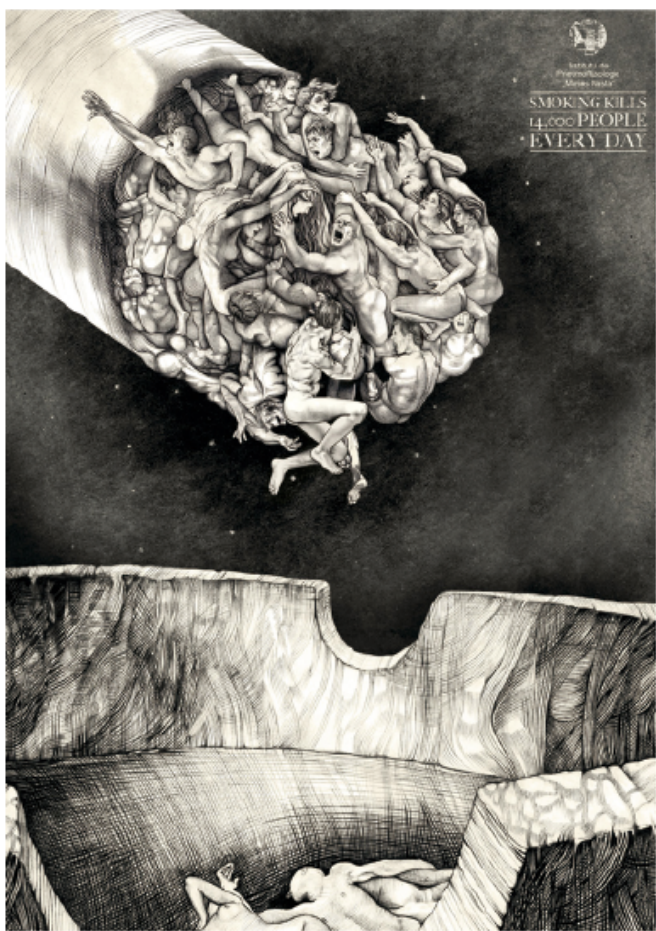
图4-5 肺病研究院/罗马尼亚/Saatchi Bucharest