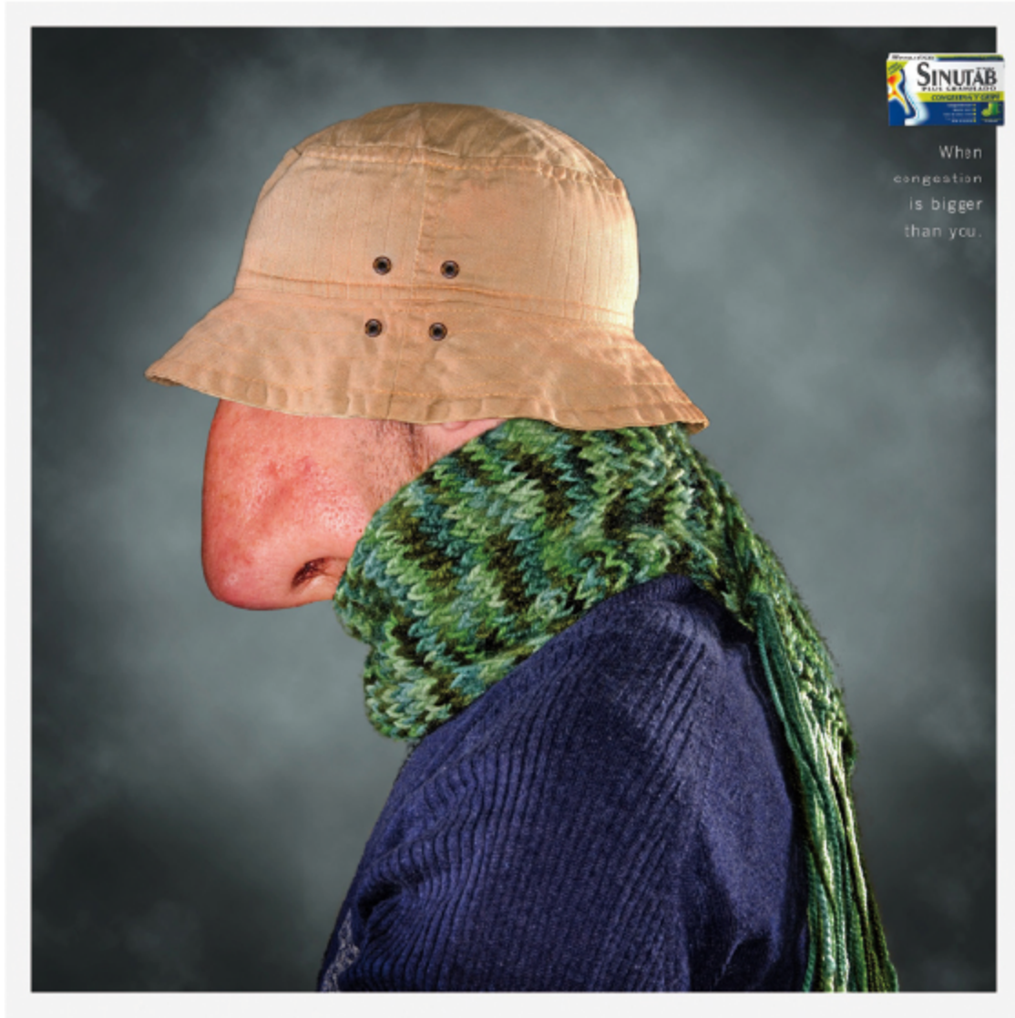
图4-1 鼻塞通/委内瑞拉 JWT