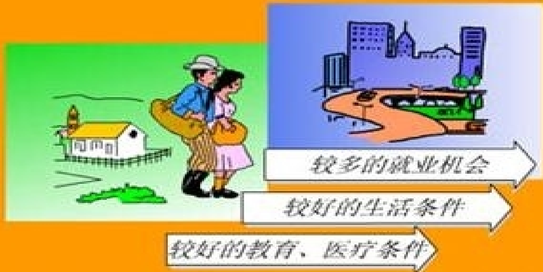
农村人口迁往城市的原因示意图