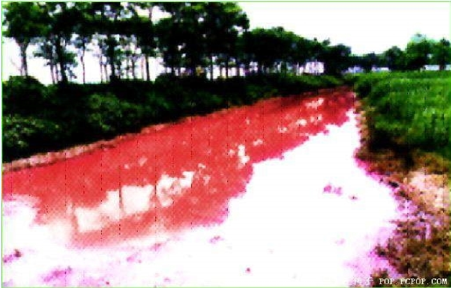
淮河上游被化工厂排出物污染