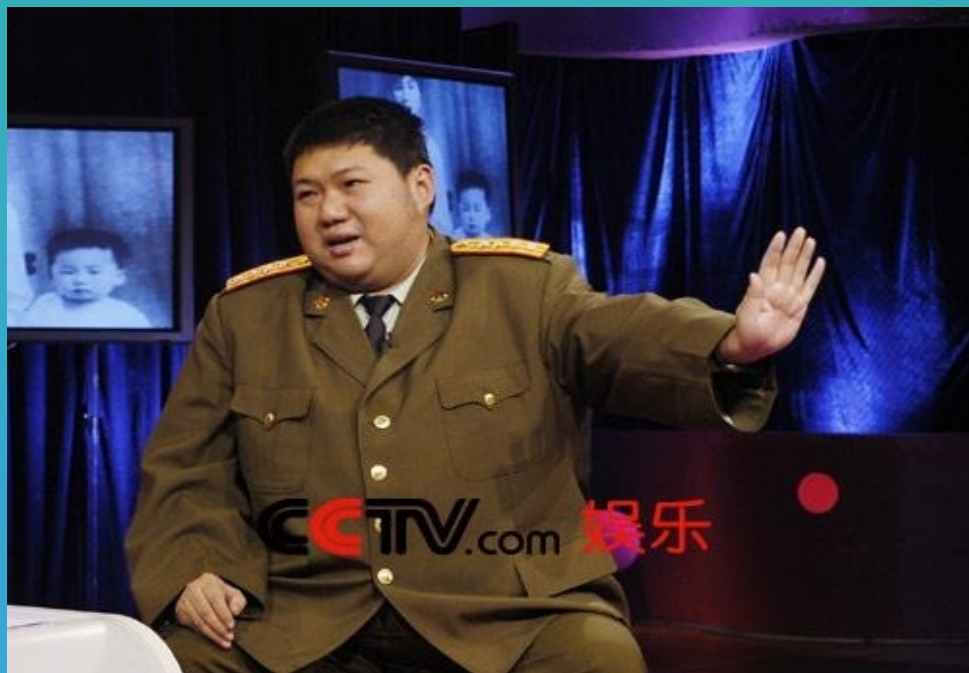
毛泽东的嫡孙、毛岸青的儿子毛新宇