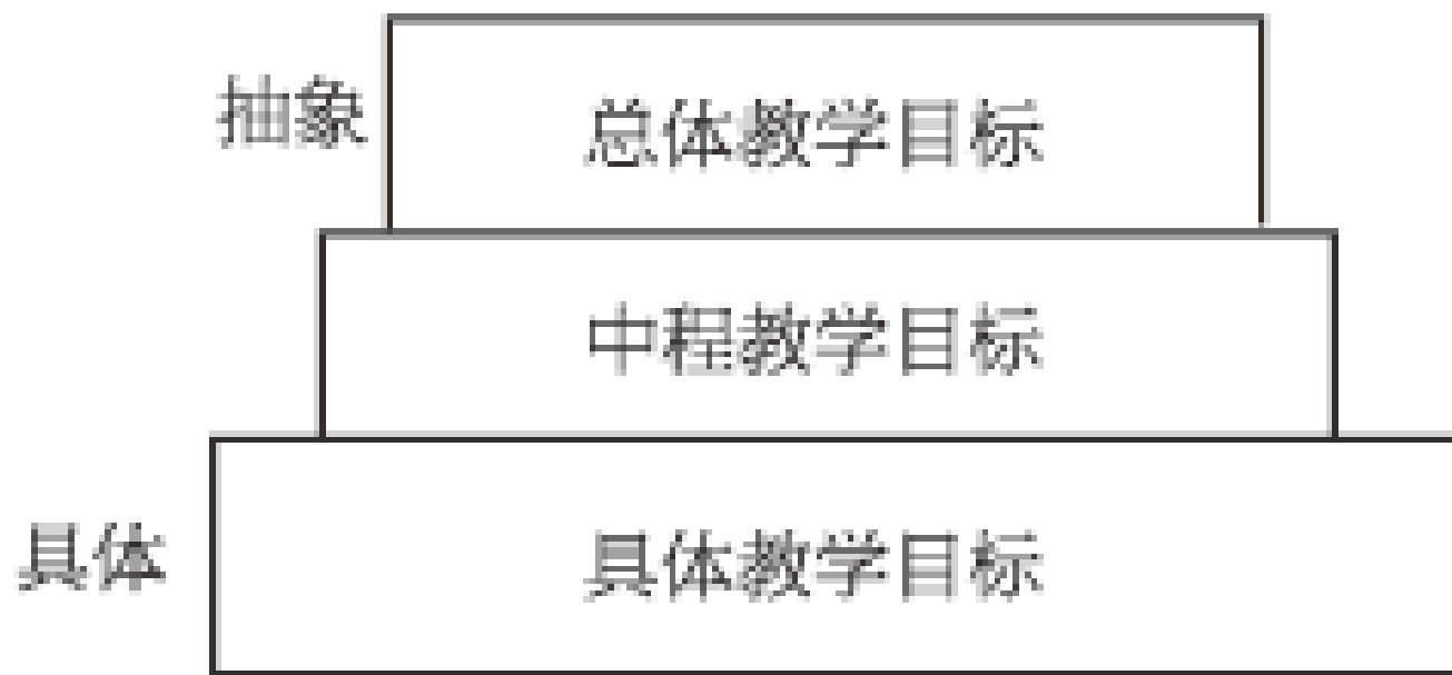
图2-1 教学目标的层阶构成示意图