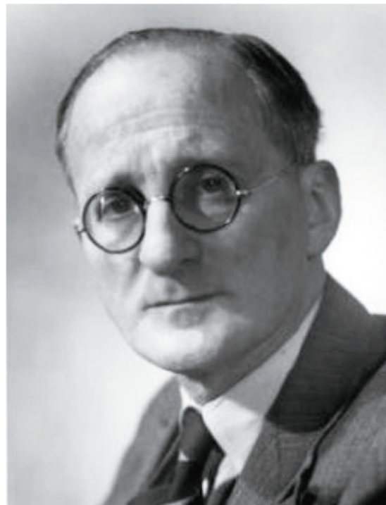
尼古拉斯·佩夫斯纳

尼古拉斯·佩夫斯纳 ( Nikolaus Pevsner , 1902—1983 ) ( 见图10-6 ) 开创了设计史研究的先河。他在1936年出版了《现代运动的先锋》 ( The Pioneers of Modern Movement , London : Faber , 1936 ) , 开创了传统设计史研究的先河。该书论述了19世纪末到20世纪前期西方现代设计运动发展的轨迹 , 研究了从莫里斯到格罗皮乌斯的一系列设计大师的设计活动和作品以及对现代设计的贡献。佩夫斯纳采用英雄史观和编年体的写作模式 , 开创了设计史的传统研究和写作的模式。此外 , 佩夫斯纳将类型研究引进设计史 , 拓展了研究者的视野 , 使得诸如视觉传达设计史、家具设计史、服装设计史等专门设计史研究纷纷出现。此后 , 设计史的研究逐步深入 , 设计史也作为单独的一门课程 , 也逐渐在高等学校设计专业教育中开设。