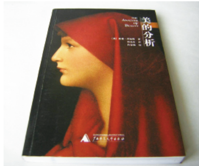
贺加斯著《美的分析》 简体中译本封面

20世纪出现了现代意义上的设计理论著作。1923年，法国建筑师勒·柯布西耶（Le Corbusier，1887—1965）（见图10-3）出版了《走向建筑》（Vers une Architecture），此书被认为是自维特鲁威《建筑十书》以来对建筑影响最大的著作。包豪斯学院的首任校长瓦尔特·格罗皮乌斯（Walter Gropius，1883—1969）与拉兹洛·莫霍利-纳吉合编的《包豪斯丛书》，包含许多有关设计教育的研究文献，对20世纪以来的设计教育产生了深远的影响。1932年，诺曼·贝尔·格迪斯（Norman Bel Geddes，1893—1958）