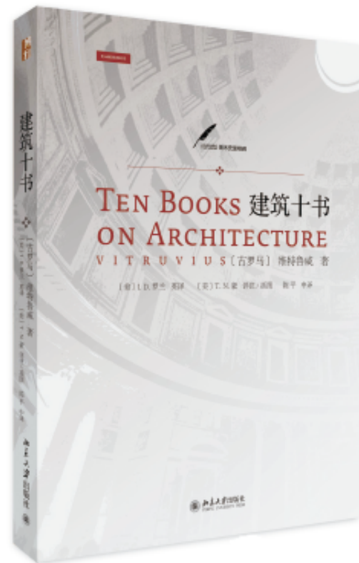
维特鲁维，T.N.豪 （插图作者），陈平（中译者） I.D.罗兰（英译者） 《建筑十书》简体中译本封面

从19世纪开始，伴随着现代设计的发展，西方的设计研究逐步兴盛起来。英国建筑师和设计师欧文·琼斯（Owen Jones，1809—1874）于1856年出版的《装饰的基本原理》（The Grammar of Ornament）被誉为装饰理论经典著作。琼斯认为设计也应具有时代特征，反对一味模仿旧有风格，提倡建立在几何学基础之上的装饰理论。作为英国杰出的作家、艺术批评家和社会主义倡导者，约翰·罗斯金（John Ruskin，1819—1900）于1849年出版了关于建筑和装饰设计原理的《建筑的七盏明灯》（Seven Lamps of Architecture），批判工业革命带来的伤害，推崇中世纪哥特式艺术的精神和道德价值，企图恢复理想的中世纪状况。克里斯托弗·德雷瑟（Christopher Dresser，1834—1904）于1862年出版了他的《装饰设计的艺术》（The Art of Decorative Design）。