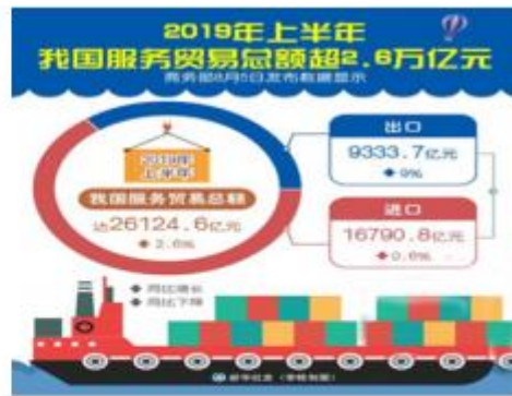
图2 2019年上半年中国服务贸易进出口额