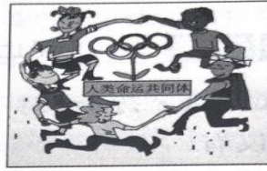
图片二 共建人类命运共同体