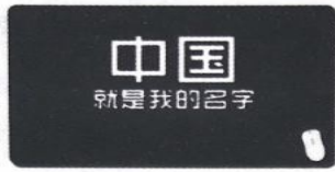
图片一 中国就是我的名字