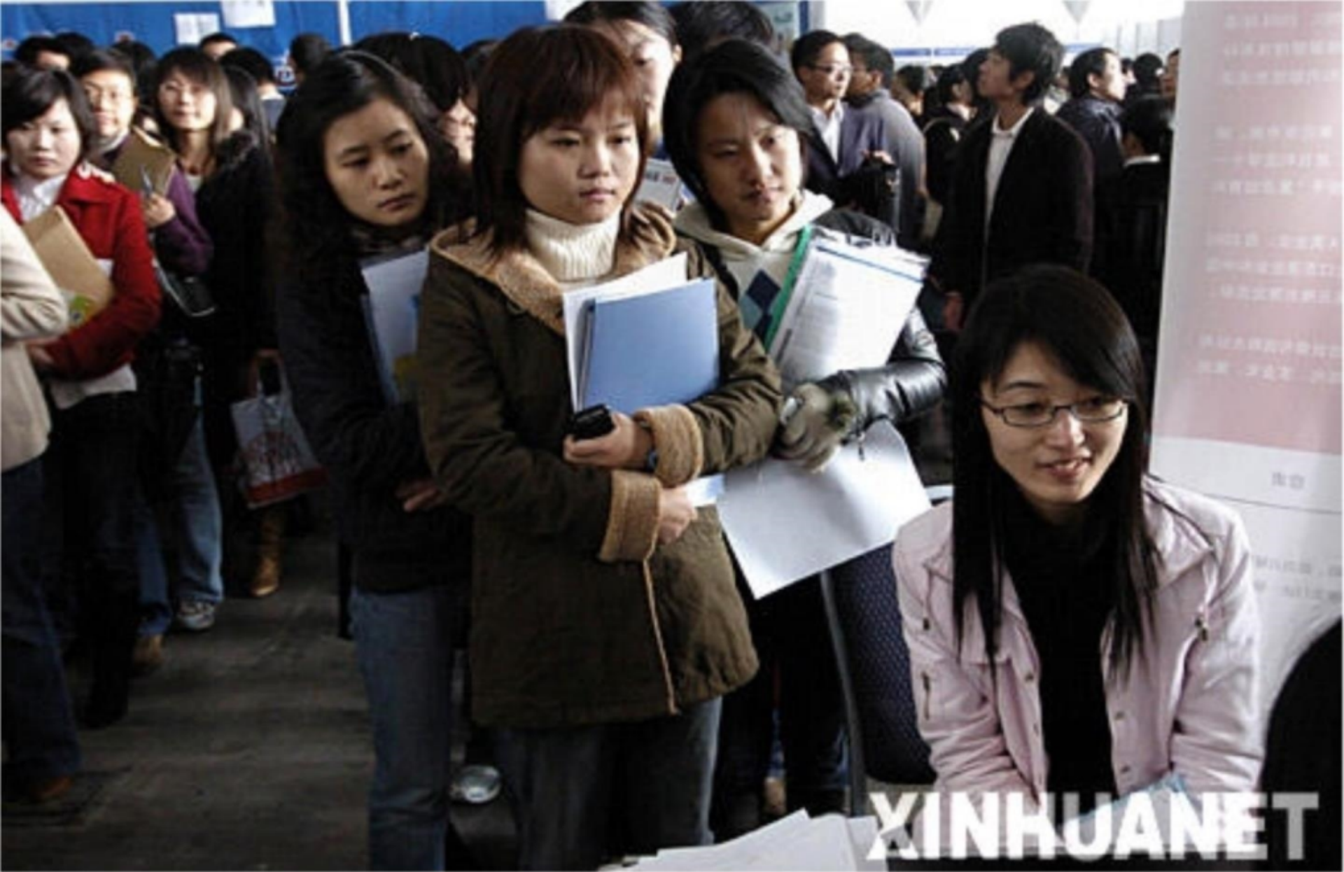
多数人手里捧着简历.排着长队等待着机会