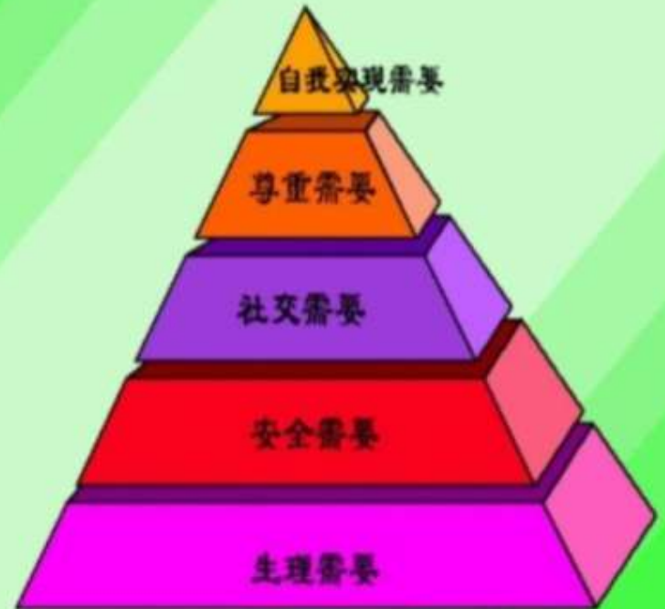
马斯洛的 需要层次论