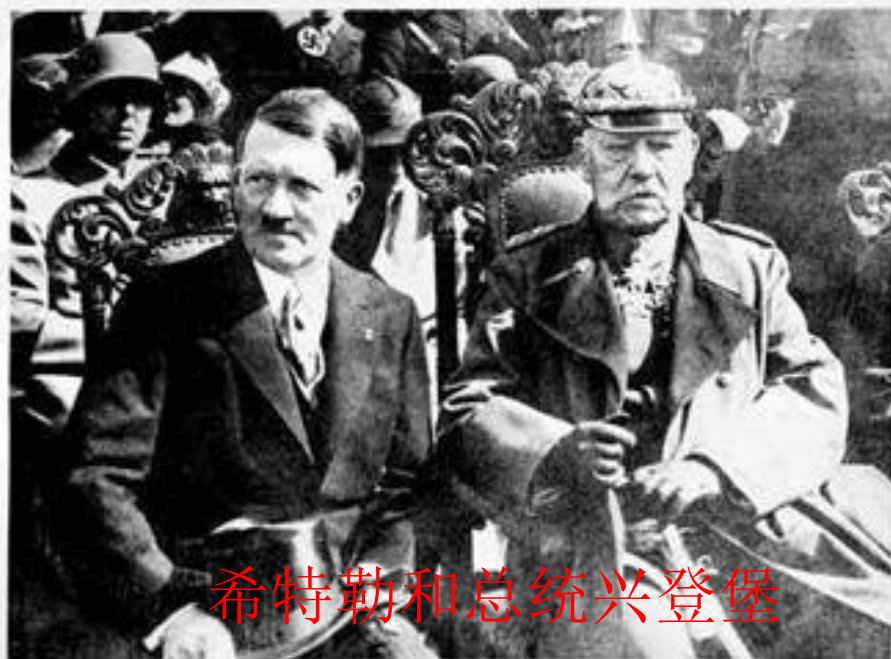
希特勒和总统兴登堡