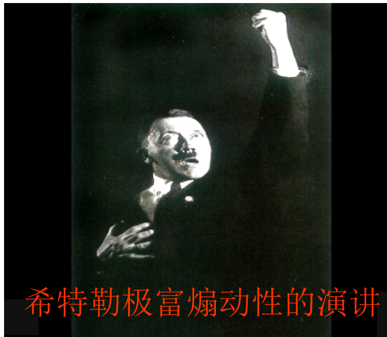
希特勒极富煽动性的演讲