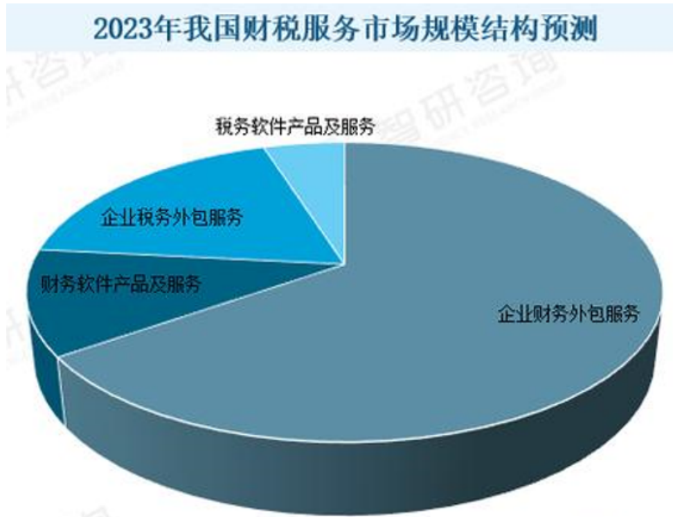
图表 9 2023 年我国财税服务市场规模结构预测

近几年，我国财税服务行业产值快速增长，从 2012 年的 693.8 亿元增长到了 2020 年的 1647.4 亿元，预计 2023 年我国财税服务行业产值有望增长至 2289.1 亿元，未来几年将保持持续增长。