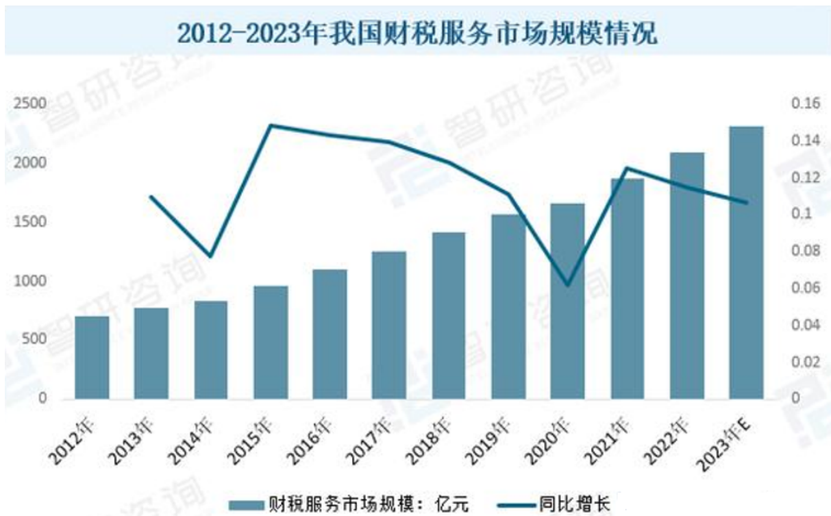
图表 8 2012-2023 年我国财税服务市场规模情况

2020 年我国财税服务市场规模从 2012 年我的 698.3 亿元增长至 1663.5 亿元，2012 年以来我国财税服务市场规模复合增速为 11.46%。预计 2023 年我国财税服务市场规模有望达到 2308.4 亿元。