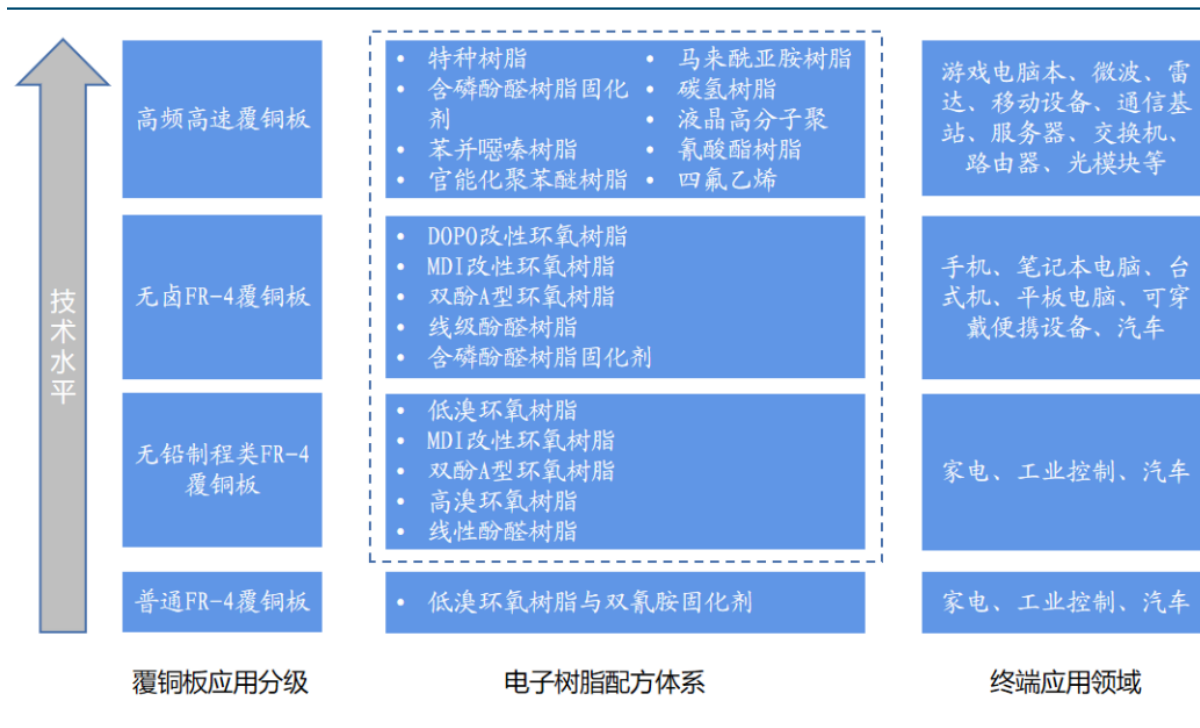
图表4：电子树脂配方体系不断发展

覆铜板是将玻璃纤维布或其它增强材料浸以树脂，一面或双面覆以铜箔并经热压制成的板状材料。以玻璃纤维布基覆铜板为例，其主要原料为铜箔、纤维布、树脂，分别占成本的 42%、26% 和 19%。5G 通讯、新能源等领域推动 PCB 快速发展，带动电子电器用环氧树脂需求水涨船高。从成本占比来说，电子树脂占覆铜板生产成本的比重约为 25-30%，在当前迅速发展的高速高频覆铜板中，电子树脂所占的成本比重将进一步提高。