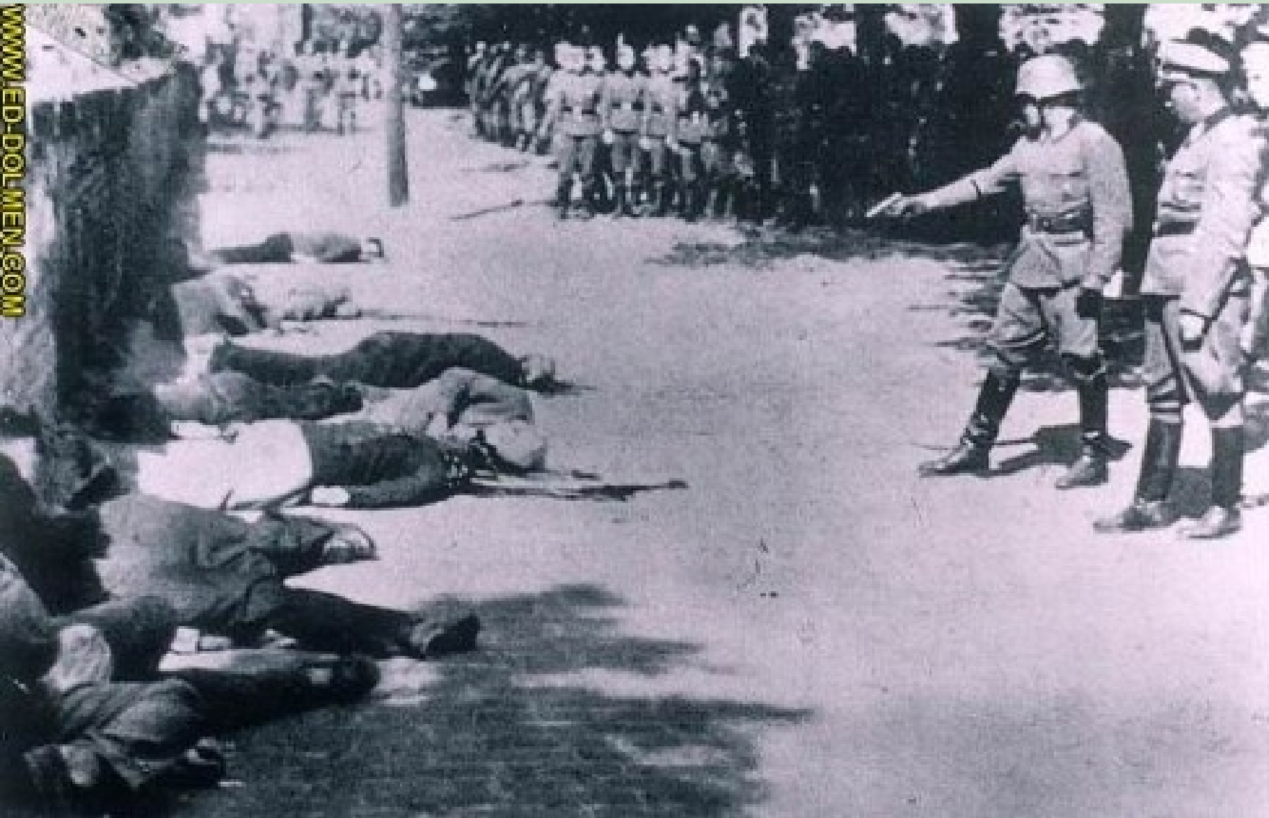
1942年，南斯拉夫贝尔格莱德，德国在枪决平民。