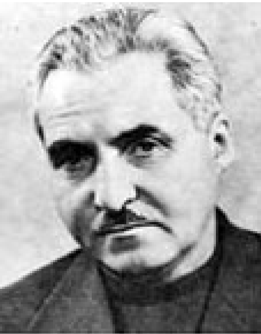
西蒙诺夫, K. M.