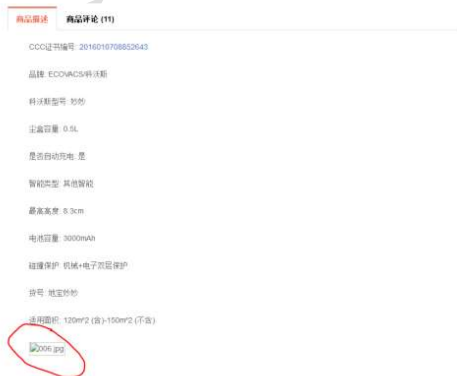
图 2-4 PC 前端商品说明界面

在商品管理后台添加新商品, 利用 Ueditor 实现商品说明信息录入如图 2-3 所示, 点击 Ueditor 的上传图片图标, 选择图片上传。