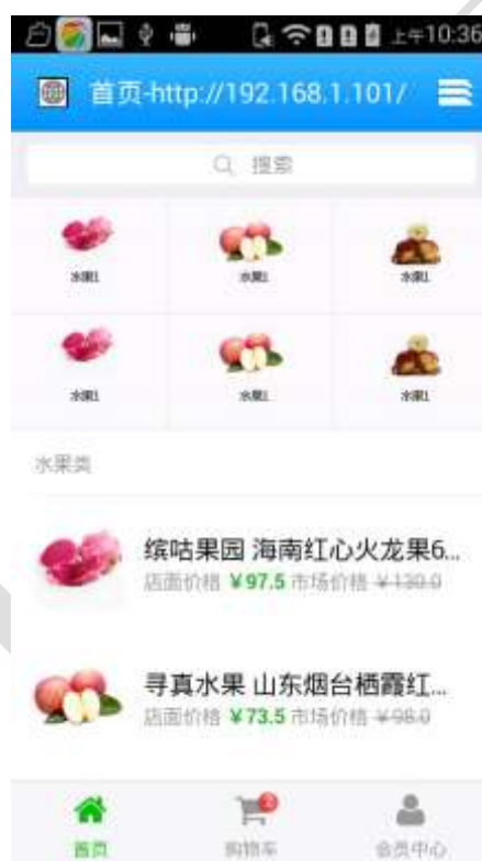
图 3-1 移动端实现热门商品的展示

利用 U 盘中“03 辅助文档\weui-master\dist\example\index.html”提供的九宫格技术，在移动端实现热门商品的 6 宫格展示。