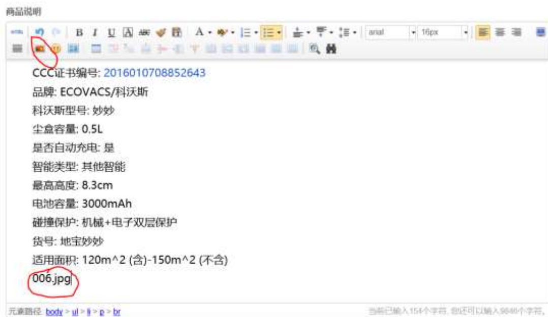
图 2-3 添加新商品说明信息界面

在商品管理后台添加新商品, 利用 Ueditor 实现商品说明信息录入如图 2-3 所示, 点击 Ueditor 的上传图片图标, 选择图片上传。