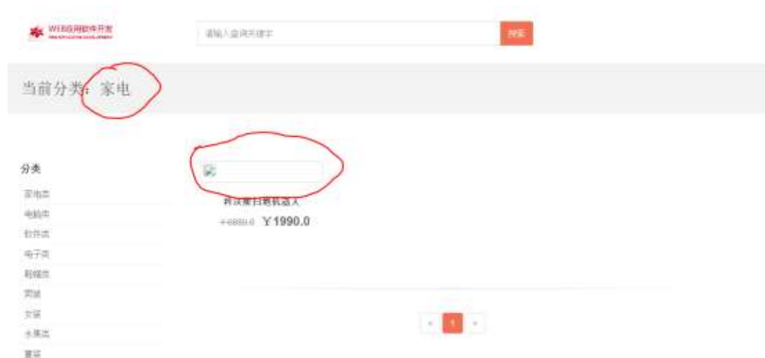
图 2-2 新商品分类显示