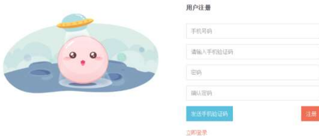
图 2-1 PC 前端用户注册界面