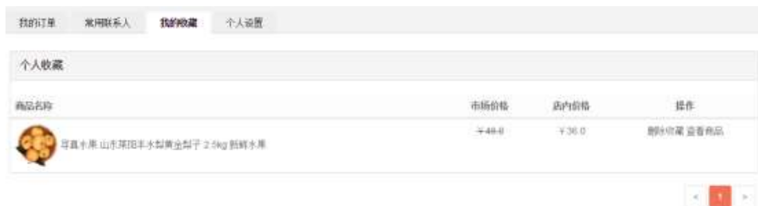
图 3-2 收藏商品管理页面