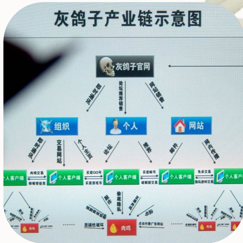
灰鸽子产业链示意图

畜牧业产业链上下游整合不足，缺乏紧密的利益联结机制，难以实现产业链的协同发展和效益最大化。